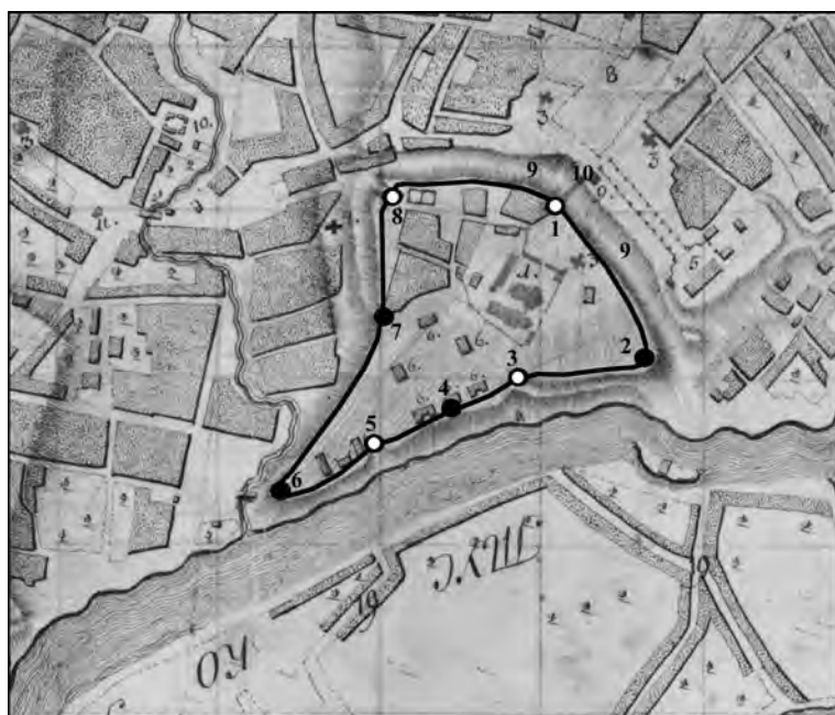
Рис.3. Схема укреплений Курска в сер. XVII в. (на основе плана города 1781-1782 гг.)