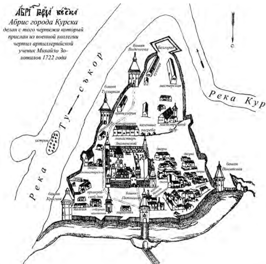
Рис.4. Укрепления Курска в начале XVIII в. (прорисовка "Абриса города Курска". 1722 г.)