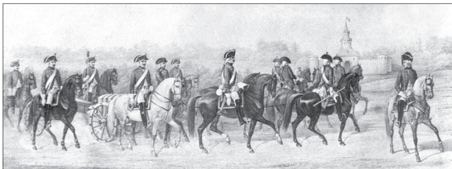
Конная артиллерия Гатчинских войск

для наставления унтер-офицеров в новоучрежденных артиллерийских баталионах, сочиненные при Артиллерийском и Инженерном Шляхетном Кадетском Корпусе», изданной в Петербурге в 1789 г. 168 Команд всего семь, и на каждого из основных номеров прислуги возложены определенные обязанности 169 . В «Кратких артиллерийских записках...» приводятся команды и описываются действия расчета только при зарядании и производстве выстрела, но нет команд и описания действий расчетов при движении орудий, и, кроме того, в них отсутствует четкое разделение расчетов на номера — все ставится в зависимость лишь от места артиллериста в строю 170 .