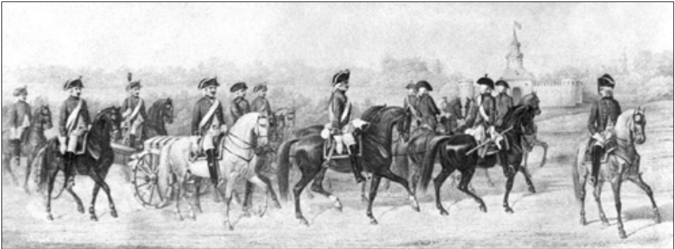
Конная артиллерия Гатчинских войск

22 февраля 1793 г. П.И. Мелиссино получил указ императрицы из КГАиФ об отправке в Гатчинские войска еще 10 человек из полевой артиллерии – 9 бомбардиров и одного столяра 37 . Соответствующий ордер был дан генерал-майору М. Мерлину 25 февраля 38 . Правда, в Гатчинские войска попали только семеро – согласно рапорту генерал-майора Мерлина П.И. Мелиссино от 2 марта 1793 г. «...прописанных... следующих к определению по воле ЕГО ИМПЕРАТОРСКОГО ВЫСОЧЕСТВА... в морские батальоны служителей по выправке (проверке. – Е.Ю.) при двуротной 2-го бомбардирского батальона команде не оказалось...» 39 .