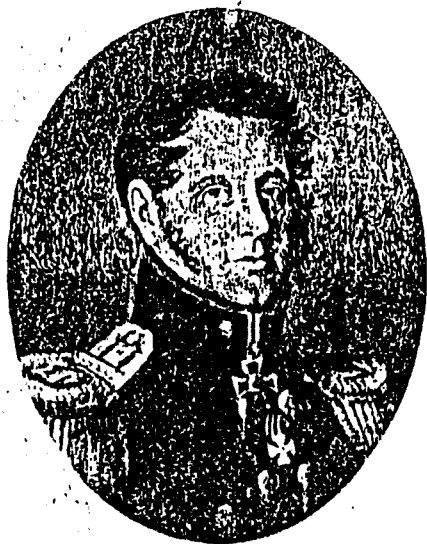
А. ИЯ. ПЕРЕСОЛЕНЪ.

лось всегда нужное число пионер, минер и сапер, кои и должны состоять всегда при главной квартире, а генерал-квартирмейстер должен отражать их по надобности батальонам, ротам или командам".