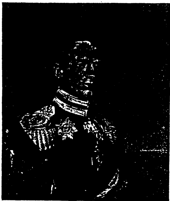
Съ портр. Г. Дав. Зимний Дворецъ.