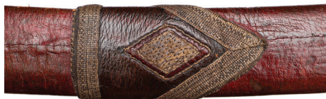
Ил. 4. Муфта с лопастью