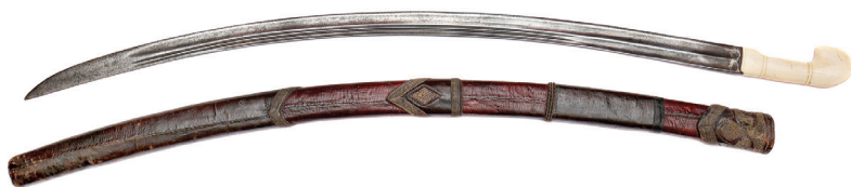
Ил. 1. Черкесская шашка и ножны, украшенные галунами. Частное собрание

изменений и постепенного усовершенствования галунных шашек. Количество и форма муфт, наличие обоймиц подвеса, устройство устья, разнообразие декоративных элементов и способов украшения – все говорит о постепенном развитии данного вида этнического оружия. Можно проследить, как, интуитивно полагаясь на собственные вкусы и навыки мастерства, знатные горянки оформляли ножны для своих мужей и братьев. Многослойность конструкции и отделка ножен, без сомнения, повторяют принципы построения традиционного костюма горцев Северного Кавказа. И не только мужского. Шаровары – чуваки – ноговицы – наколенники уже давно известный пример. Похожее устройство имели рукава на женских платьях, имеющие особые лопасти с аппликациями и галунами, на женских кафтанчиках – в виде нарукавников и кожаных нагрудников с застежками.