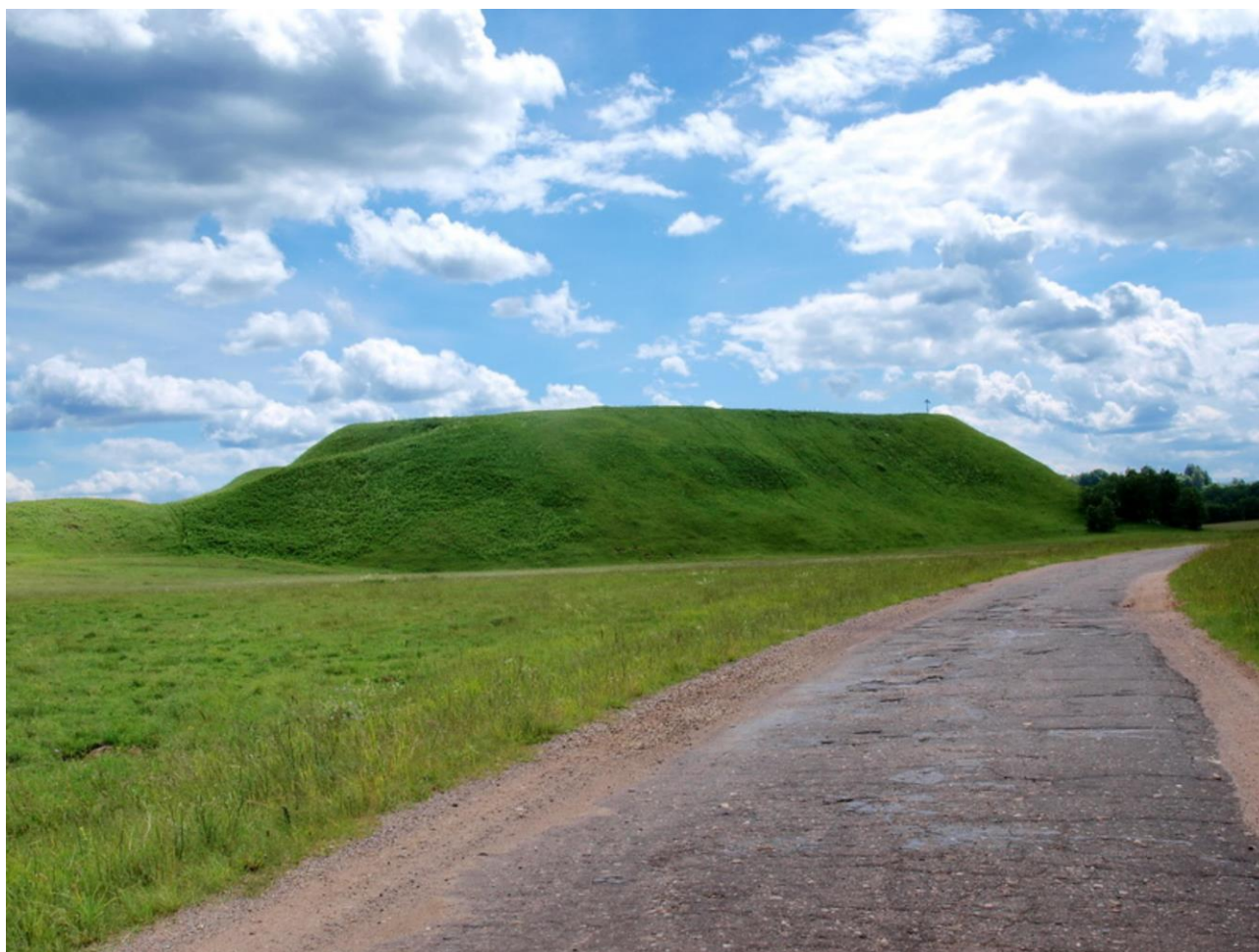
Княжая гора - место новгородского городка Демон.

Таким образом, Демон продержался примерно до начала 20-х чисел июля, в течении декады, а может быть, и полутора. И, вероятнее всего, мог бы выдерживать неприятельскую осаду еще в течении некоторого времени. Городок не имел каменных стен. Однако крутые склоны Княжой горы очень неудобны для штурма. Неудивительно, что в 1441 г. он тоже фактически не был взят москвичами и тверичами.