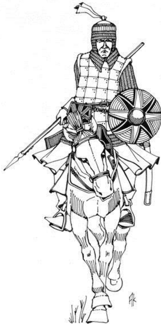
Татарин сер. XV в.

Со времени гибели Шемяки обычно принято считать окончание так называемой Феодалной войны. Как политик Шемяка был сокрушен еще в 1452 г., когда его с участием Басенка выгнали с Русского Севера, а окончательно уверенно Василий Темный почувствует себя в 1456 г., когда во главе с тем же Басенком пошлет в Приильменье «изгонную» рать, чтобы рассчитаться с новгородцами за то, что те принимали Шемяку, и как-то заставить их считаться с великокняжеской властью. Одной из важнейших причин, по которой Василий до этого времени не пошел на Новгород, была постоянная угроза нападений на русские рубежи татар Большой Орды, которой правил хан Сеид Ахмет.