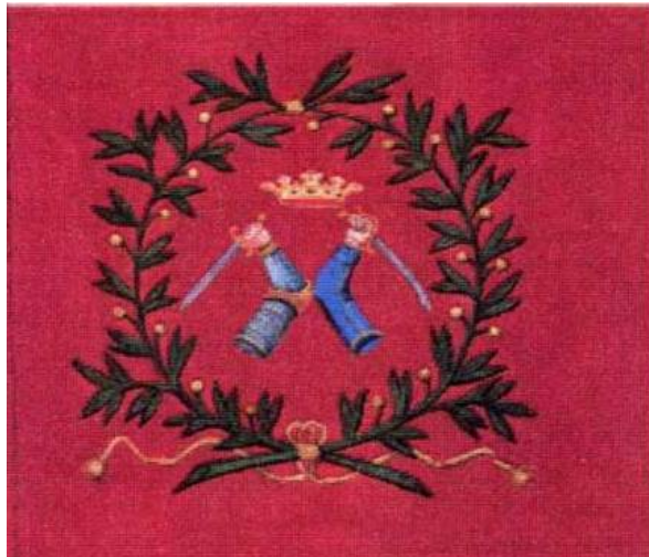
Рис. 2 Ротное знамя Выборгского пехотного полка (обр. 1686 г.) (красное полотнище)

Lars-Eric Höglund, Åke Sallnäs. The Great Northern War 1700-1721. Colours and Uniforms. Karlstad: Acedia Press, 2000