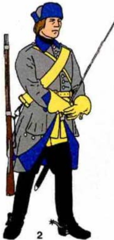
Рис 5 Униформа солдата Выборгского пехотного полка. 1688 г.