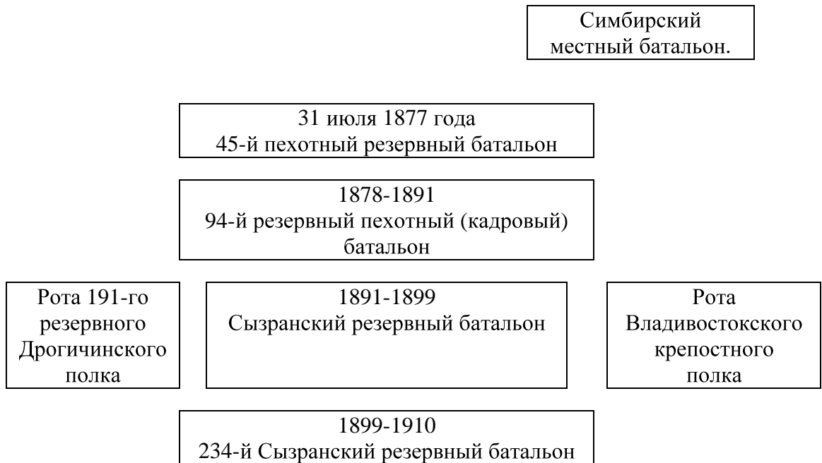
Схема переформирований и переименований батальона с 1877 по 1910 год