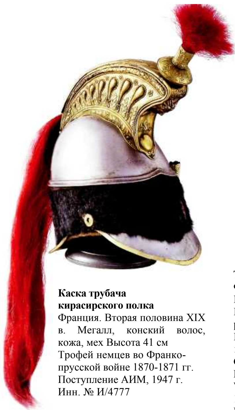
Каска трубача кирасирского полка Франция. Вторая половина XIX в. Мегалл, конский волос, кожа, мех Высота 41 см Трофей немцев во Франко- прусской войне 1870-1871 гг. Поступление АИМ, 1947 г. Инв. № И/4777