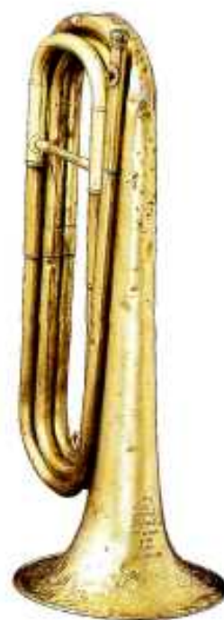
Труба альтовая (без мундштука) Франция. Конец XIX в. Медь, штамповка Размеры: длина 49,5 см, диаметр раструба 19 см На внешней стороне раструба клеймо: «Ouvriers reunis /associatijn/ Generale/de L'armee/Paris/A. BOHN/A. GUEB WILLER» Поступление: АИМ, 1946г. Инв. № 16/477