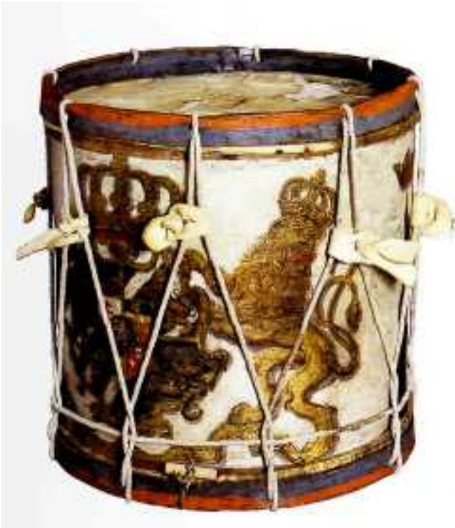
Барабан Гвардейского пехотного полка Швеция. Первая половина XVIII в. Дерево, железо, кожа, роспись по дереву Размеры: высота 43 см, диаметр 42 см Предположительно, трофей Русско-шведской войны 1741-1743 гг. Поступление: 1940г. Инв.№ 16/376