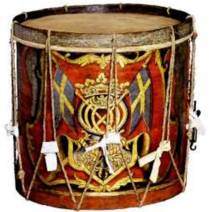
Барабан Ниландского (?) пехотного полка Швеция. Первая половина XVIII в. Дерево, железо, кожа, роспись по дереву. Размеры: высота 45,5 см, диаметр 48 см. Предположительно, трофей Русско-шведской войны 1741-1743гг. Поступление: АИМ, 1940 г. Инв.№ 16/377