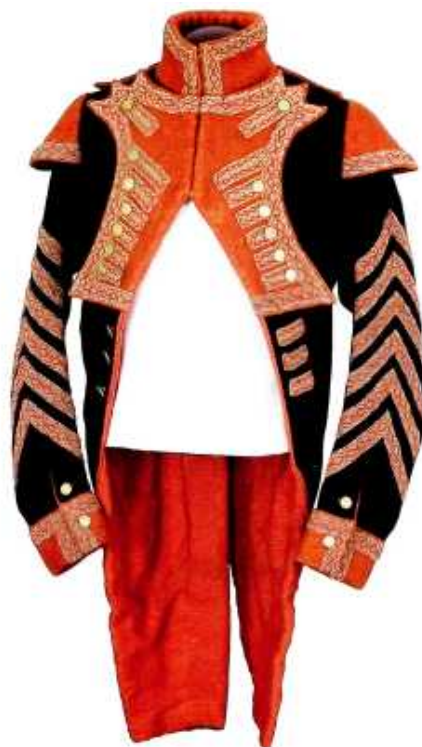
Мундир музыканта Мундир музыканта 48-го линейного полка Прусского Императора Александра Гвардейского Гренадерского полка № 1 Пруссия. 1881 г. Сукно, холст, медь, тесьма, галун, шнур, штамповка, вышивка Высота по спинке 77 см Поступление: ДИМ, 1947г. Инв№ 12/7724