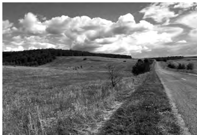
Рис. 4. Остатки Рыбинского вала

Первая сторожа «на юг» выставлялась в семи верстах от города на земляном валу, который был «осолонен дубовым лесом». Его протяженность составляла 498 сажень – от реки Тихой Сосны до заповедного леса. Рядом с будущим селом Рыбендорф (Рыбное), построенным немецкими колонистами в 1766 году и озером Рыбное, высохшим в настоящее время. Это, без сомнения, Рыбинский вал.