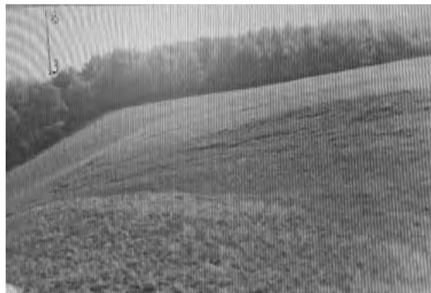
Рис. 6. Вал с левой стороны Острогожска