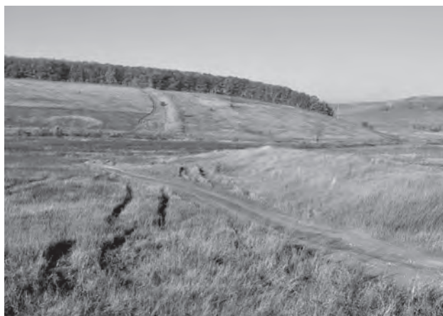
Рис. 2. Турецкий вал

На косогоре впереди, вал на правом берегу Острогощи. Справа от проселочной дороги, на левой стороне реки, фрагмент вала левой стороны. Течение бывшей реки справа – налево.