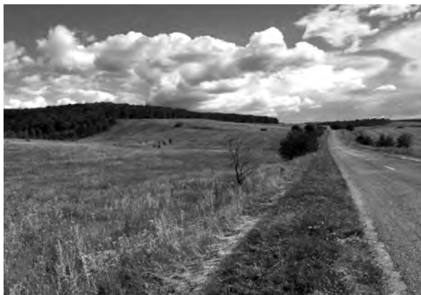
Рис. 5. Остатки Рыбинского вала