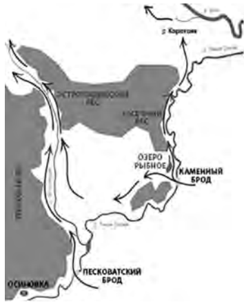
Рис. 8. Путь прохождения Кальмиусской сакмы на Русь, вдоль берегов Острогожска и Тихой Сосны