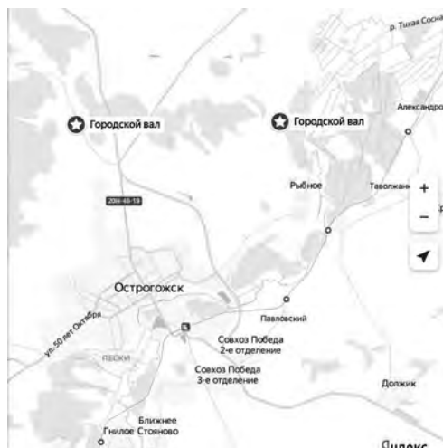
Рис. 1. Расположение «старинных» валов на современной карте.

Многие краеведы ошибочно считают, что уже во время строительства Острогожска в 1652 году Острогоща была небольшим ручьем. Какой она была в те далекие времена? С детства помню, по улице Медведовской, на Майдане небольшой мост через Острогощу. Под ним постоянно протекал небольшой ручеек. Направо,