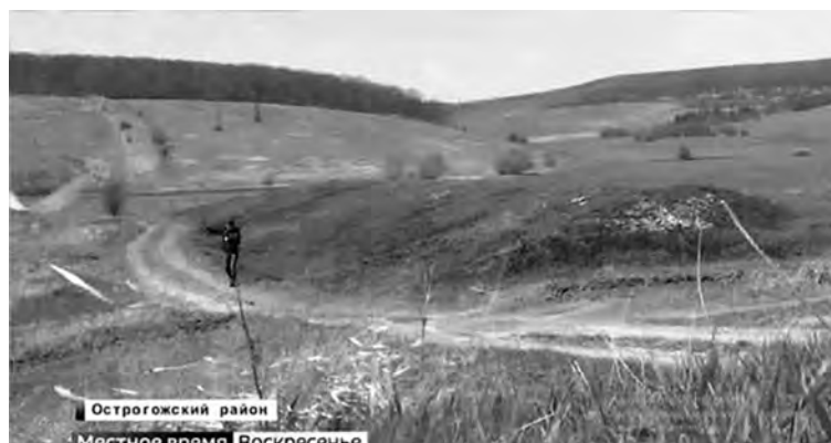
Рис. 10. Фрагмент вала на левом берегу Острогжска

Можно, не без основания полагать, что Арсентьев, восстанавливая вал, изменил его расположение на левом берегу Острогжска. Очевидно, первоначально этот вал был построен от Острогжска до леса, на одном уровне с валом на правом берегу реки – фрагмент вала. Он явно насыпной. Многие краеведы и сейчас считают его основным валом на левом берегу Острогжска. Возможно, Арсентьев решил более эффективным и, более экономичным, расположить левобережный вал, по гребню крутого склона горы, где он расположен сейчас. Не исключено, что серьезный ремонт вала и изменение расположения вала на левом берегу послужило основанием для утверждения Арсентьевым, что вал через Острогощу сделан в 1652 году, во время строительства Острогжска. Какой из валов, фрагмент вала или вал, расположенный на гребне горы по левой стороне Острогжска, в действительности возводил воевода Арсентьев, можно будет определить только при их раскопках.