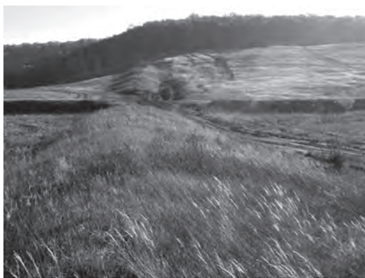
Рис. 3. Турецкий вал. Вал, на левой стороне Острогощи

сожаления. Продолжает оставаться неразгаданной одна из знаковых достопримечательностей Острогожска, история создания которой, до сих пор оставалась неизвестной. С какой целью, кем и когда вал был сооружен? В Острогожском телевизионном форуме существует несколько версий. Среди краеведов любителей были предположения о том, что Турецкий вал когда-то был границей России с Украиной, что вал разделял между собой Острогожский и Коротожский районы, что вал через Острогощу был построен пленными турками, после войны 1878 года, лечившимися в Острогожске. И другие, мало вероятные версии.