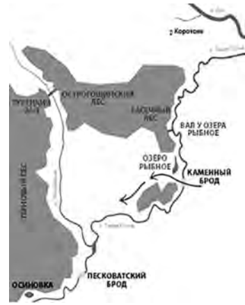
Рис. 9. Валы, преградившие путь по Кальмиусской сакме у Рыбного и через Острогожцу

татарский переход. Дальше, вниз до Дона, через Тихую Сосну удобных для татар бродов не было.