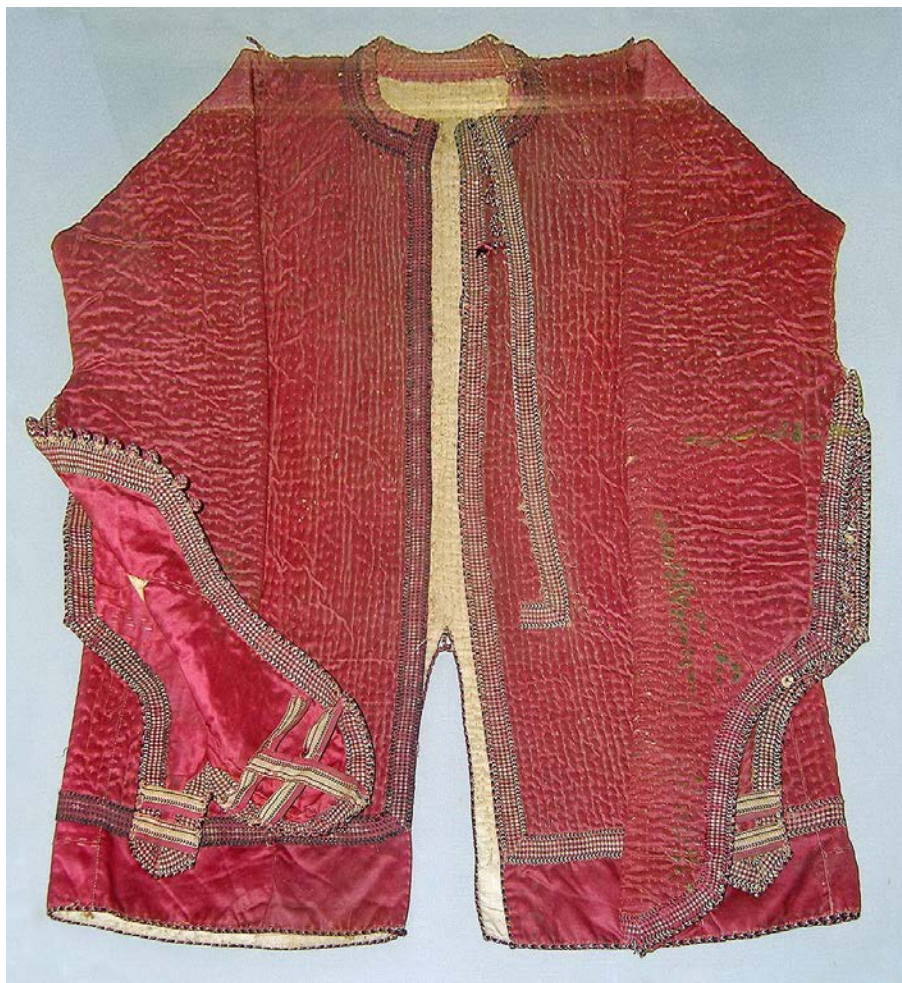
Казаганд с длинными рукавами, приписываемый Великому Визиру Махмуд Паше Собрание Военного Музея в Стамбуле, Турция 17

Другой образец распашного казаганда, но с длинными рукавами, хранится в Военном музее Стамбула ( Istanbul Military Museum ). Он, в отличие от первого турецкого образца, с длинными рукавами, закрывающими кисти воина. Рукава имеют окончания в виде своеобразных рукавиц с одним большим пальцем для защиты кистей рук, очень похожего типа с теми, что употреблялись в комплекте с наручами