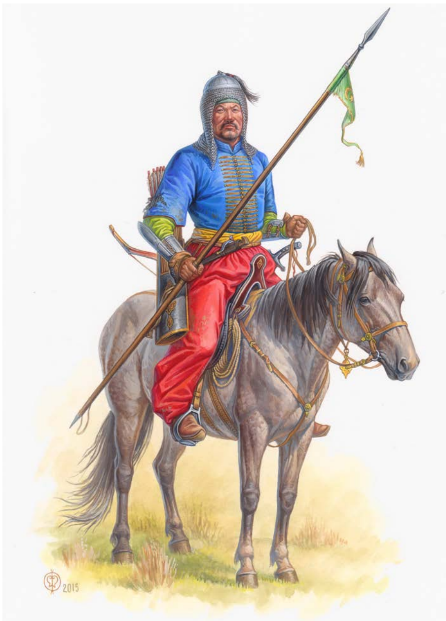
Знатный татарский всадник Крымского ханства в казаганде, кон. XVI – нач. XVII вв. Худ. О.В. Федоров, 2015 г.