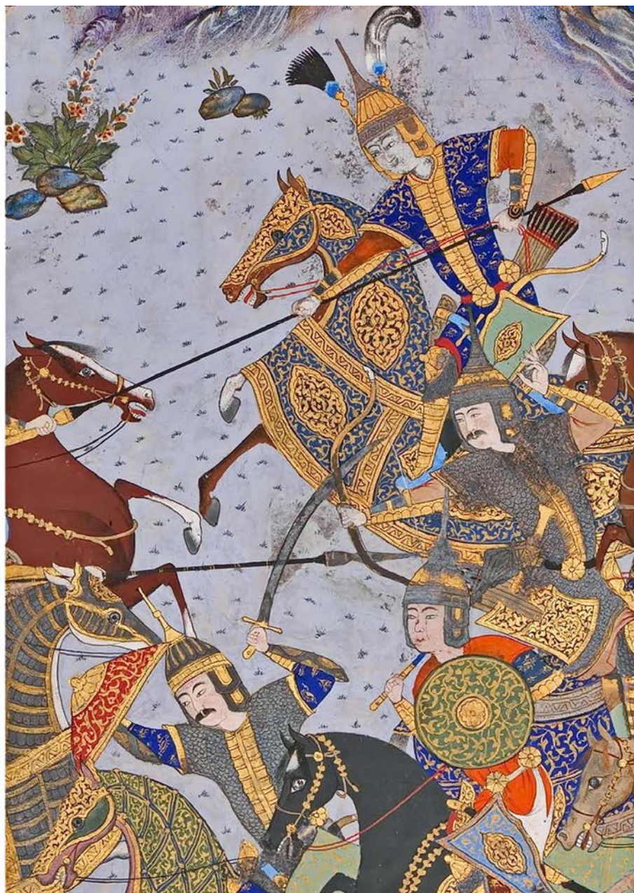
Воины в казаганде и в кольчатых доспехах с разрезом на груди Фрагмент миниатюры из цикла Шахнаме, 1530–1535 гг. Тебриз, Иран 15