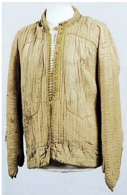
Казаганд с длинными рукавами, XVII век. Собрание Королевского Арсенала в Лидсе, Великобритания 20