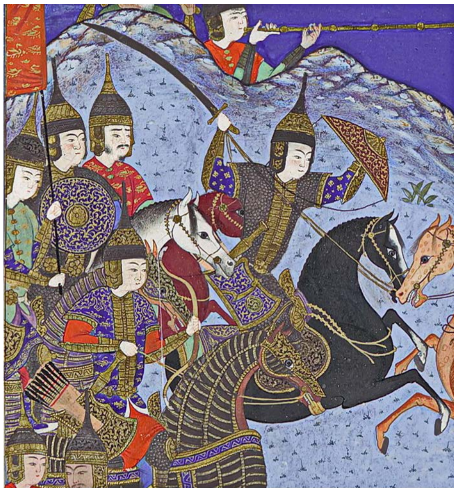
Воины в казаганде и в кольчатом доспехе с одинаковым оформлением разреза на груди Фрагмент миниатюры цикла Шахнаме, Тебриз, Иран, 1525–1530 гг. 16

и с расположенными на них поперек «застежками-разговорами». Другая часть этих воинов изображена в цветных одеждах с коротким рукавом, но с таким же оформлением разреза и нашивок на груди, как и у тех, что в открытых кольчугах. Можно предположить, что на миниатюре все эти воины в распашных кольчугах с коротким рукавом, но часть из них в кольчугах, полностью скрытых тканью — в казагандах.