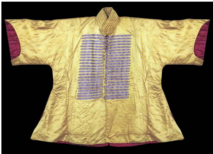
Казаганд с короткими рукавами султана Мехмеда II, 1470 г. Собрание музея Дворца Топкапы Стамбул, Турция 13

слоев ткани с кольчугой внутри и покрыт сверху шелком. Находится доспех в музее Дворца Топкапы ( Топкапи Palace Museum ), и определен он как кольчужная рубашка османского султана Мехмета II, датирован 1470 годом. Такой доспех с виду ничем не отличается от обычных мужских одежд. Возможно, этим частично объясняется видимое отсутствие корпусных защитных доспехов у многих воинов на миниатюрах Ирана и Турции XV–XVI веков. Эти всадники часто изображены в шлемах, с наручами, с защитой ног, но в обычных с виду верхних одеждах. Возможно, эти одежды скрывают доспехи воинов, но так могут изображаться и сами доспехи типа казаганд. Иногда можно разглядеть края кольчуг, свисающих из-под коротких рукавов одежд. На некоторых миниатюрах рядом изображены однотипно вооруженные воины, но у них немного по-разному выглядит защита корпуса. Часть этих воинов изображена в открытых распашных кольчугах с короткими рукавами, с нашивками на груди в виде полос ткани по краям разреза