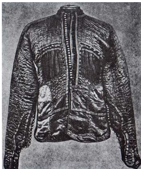
Казаганд с длинными рукавами (XVI–XVII вв.) 19