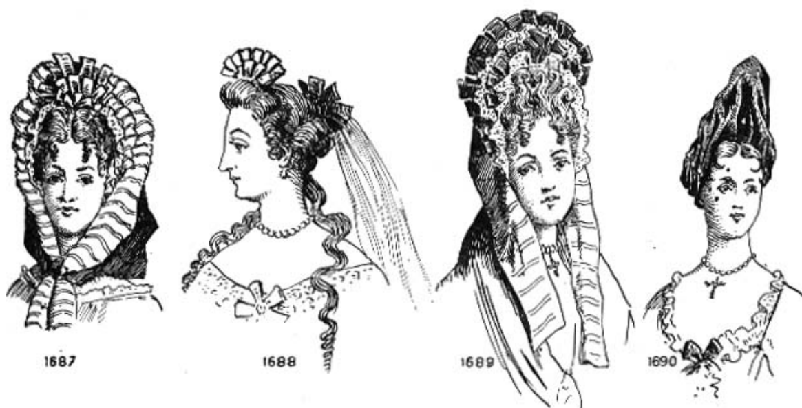
Fig. 72 Coiffures diverses. Изменение прически 1687-90