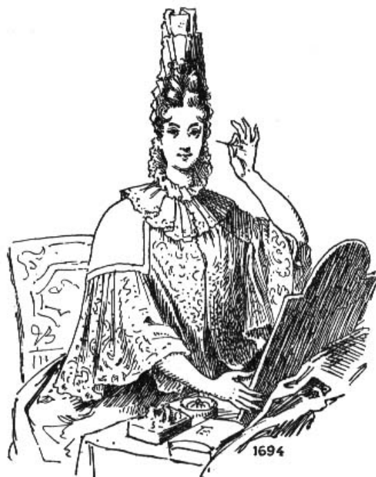
Fig. 78 Peignoir, Madame de Dangeau à sa toilette.