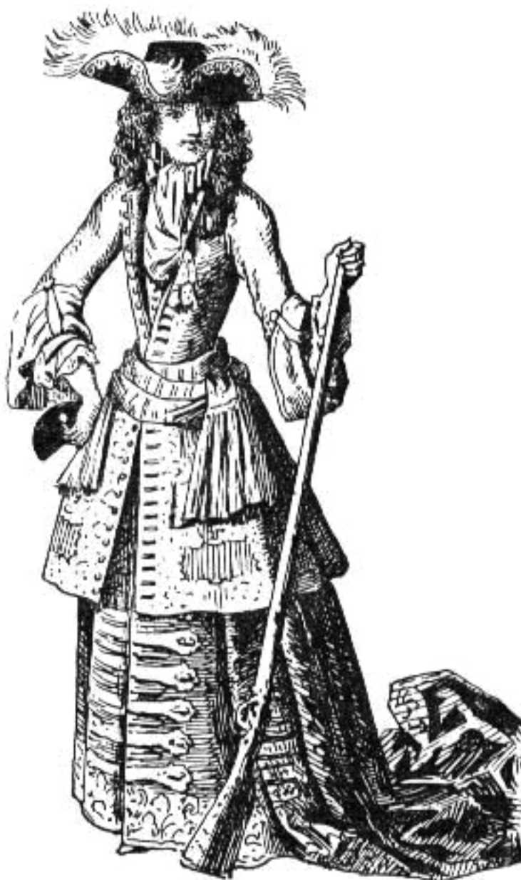
Полный охотничий костюм, 1692-1720.

Поскольку верховая езда играла в жизни людей той эпохи существенную роль и, кроме того, являлась модным видом спорта, занимавшиеся верховой ездой дамы приняли наиболее практичный для своего времени стиль одежды. То есть костюм дамы-наездницы был, за исключением юбки, точной копией костюма мужского. Камзол или казакин повторял мужской. На нем сзади и по бокам делались разрезы (боковые разрезы прикрывались складками материи), что увеличивало ее видимый объем. Камзол можно было застегнуть спереди на пуговицы от шеи до подола, однако его всегда носили нараспашку, так, чтобы был виден облегающий жилет, застегнутый только у талии. Застежка была сделана на мужской манер - слева направо. Вверху между бортами камзола или казакина и жилета виднелось модное в то время шейное украшение - шарф Steinkirk. Распахнутые полы являли взору очень широкую "стоячую" оборку, начинавшуюся примерно у середины юбки. Юбка была свободной и доходила примерно до щиколотки.