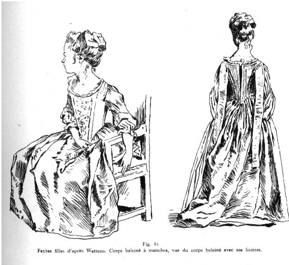
Fig. 81 Petites filles d'après Watteau. Corps baleiné à manches, vue du corps baleiné avec ses lisières.

Little girls painted by Watteau, note the leading strings