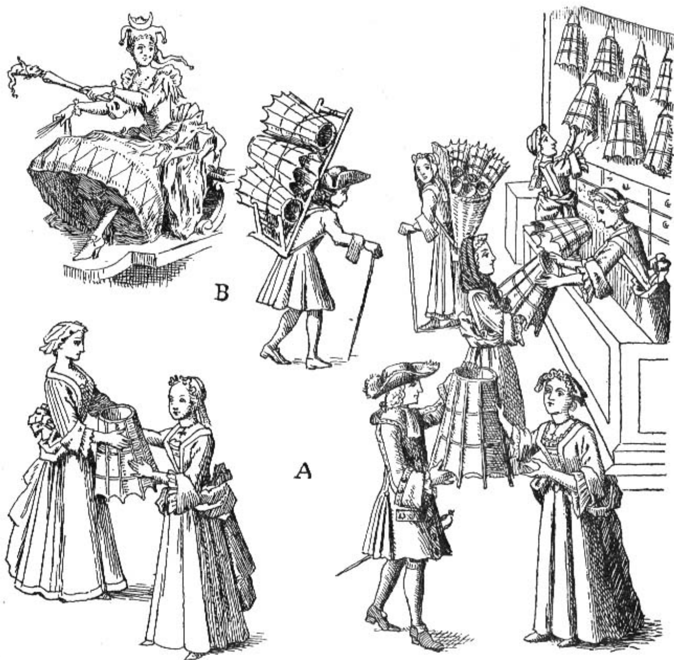
Fig. 60 A. Le marché aux paniers 1719, paniers en forme de cages. Fragments — B. la folie dans « la fortune en actions » de Bernard Picart 1720.