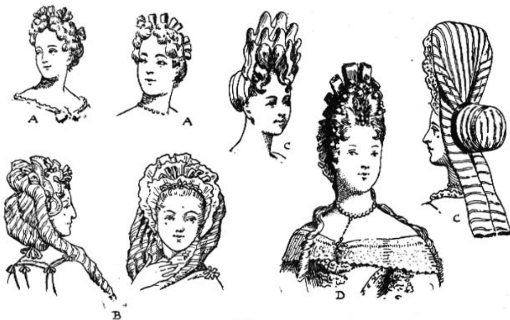
Fig. 71 A.A. Coiffure en 1683 — B. coiffure en Sultane d'après Arnouldt 1688. C.C. coiffes en 1691 — D. coiffure de cour 1694.

Для тепла бытовали мягкие меховые воротники, которые свободно накидывались на плечи и крепились на груди бантом или драгоценной брошью.