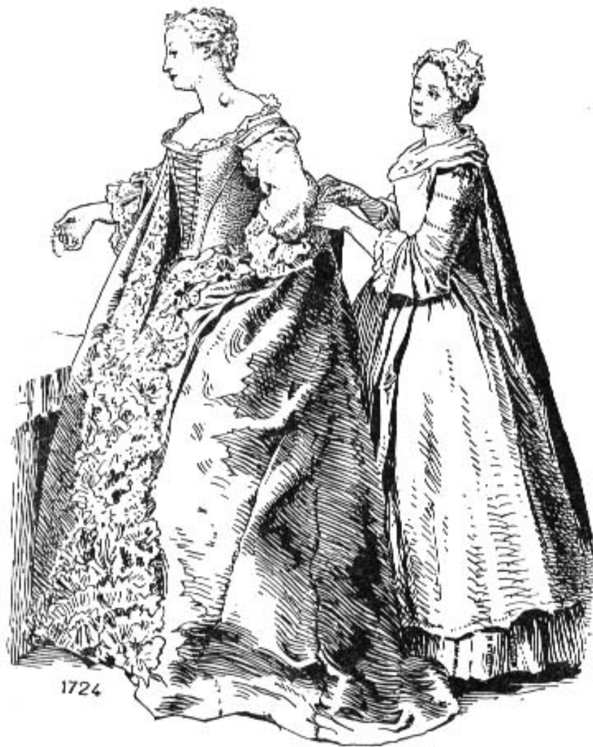
Fig. 59 Façon de mettre la robe battante ouverte devant jusqu'à mi-hauteur d'après de Troy.

A maid puts on a lady's gown over a set of stays, 1724