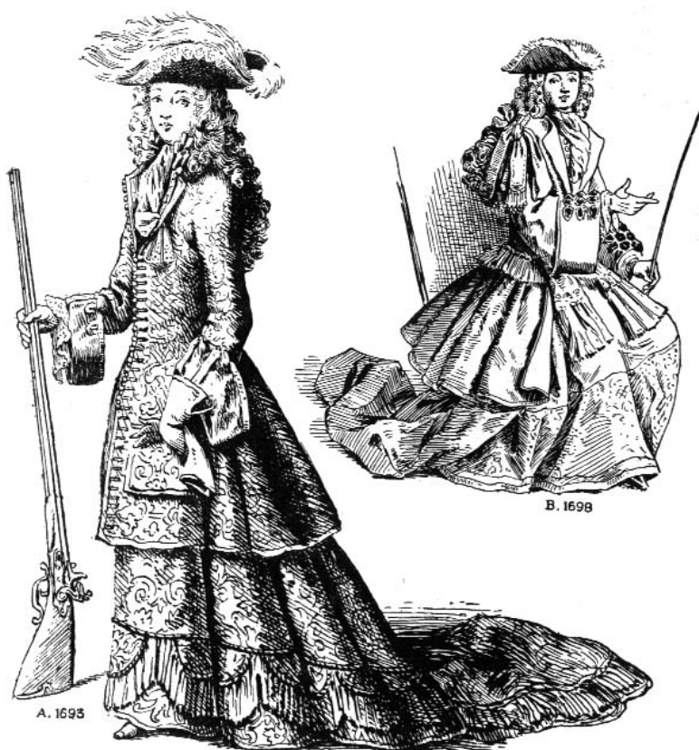
Fig. 47 Costume de chasse, A. Madame en habit de chasse — B. Princesse Palatine en amazone.

С установлением более-менее стабильного общественного уклада во Франции и Англии (конституционная монархия в Англии и абсолютная монархия во Франции), мода конца 17-го века перестала резко меняться и сильно влияла на моду следующего века, претерпевая незначительные изменения, но не меняясь коренным образом примерно на четверть века.