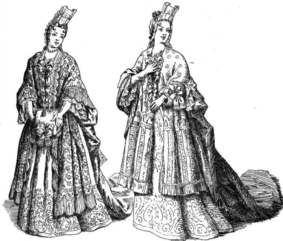
Fig. 63 Capes mantilles à effilés et prétintailles laissant voir l'une, le bout-en-train, l'autre l'échelle de rubans appliqués sur le devant du corps à baleines, 1697.