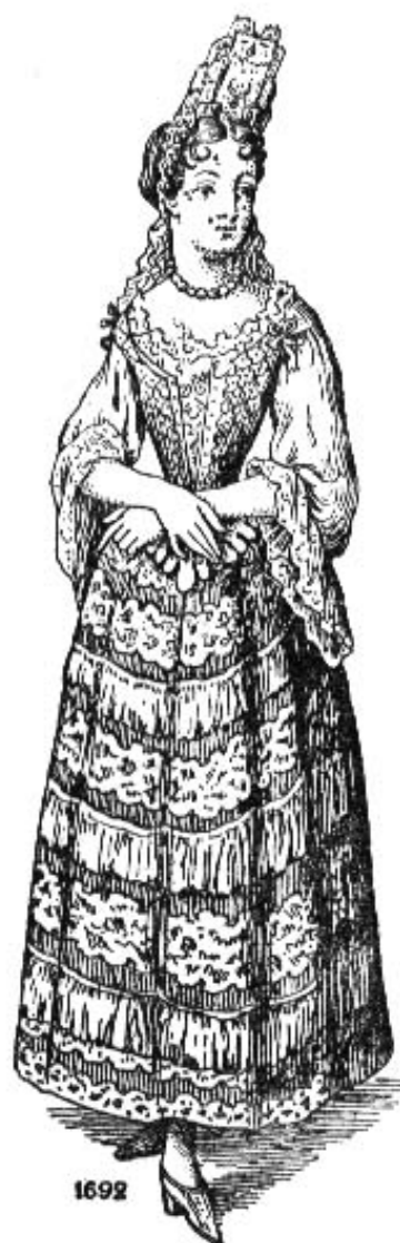
Fig. 49 Corps à baleine ouvert, non lacé montrant la pièce d'estomac sur la chemise

Boned bodice/stays worn over a fancy shift and decorated petticoat, 1692