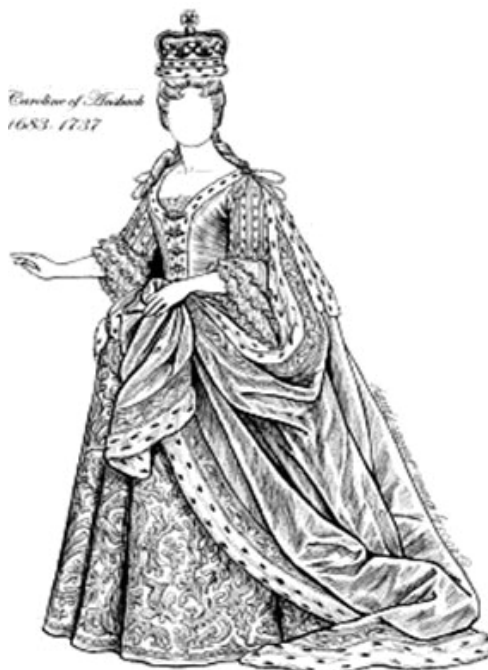
Эскизы костюмов царственных особ 1717,

По подолу ее украшала широкая полоса кружева. Волосы скрывал парик - опять-таки как у мужчин. Локоны парика обрамляли лицо и ниспадали с обеих сторон на спину. К 1720 году парики стали компактнее и перестали копировать мужские. Шляпу-треуголку надевали или просто носили с собой. На руки надевали короткие с раструбами перчатки для верховой езды и носили украшенную кисточкой плетку.