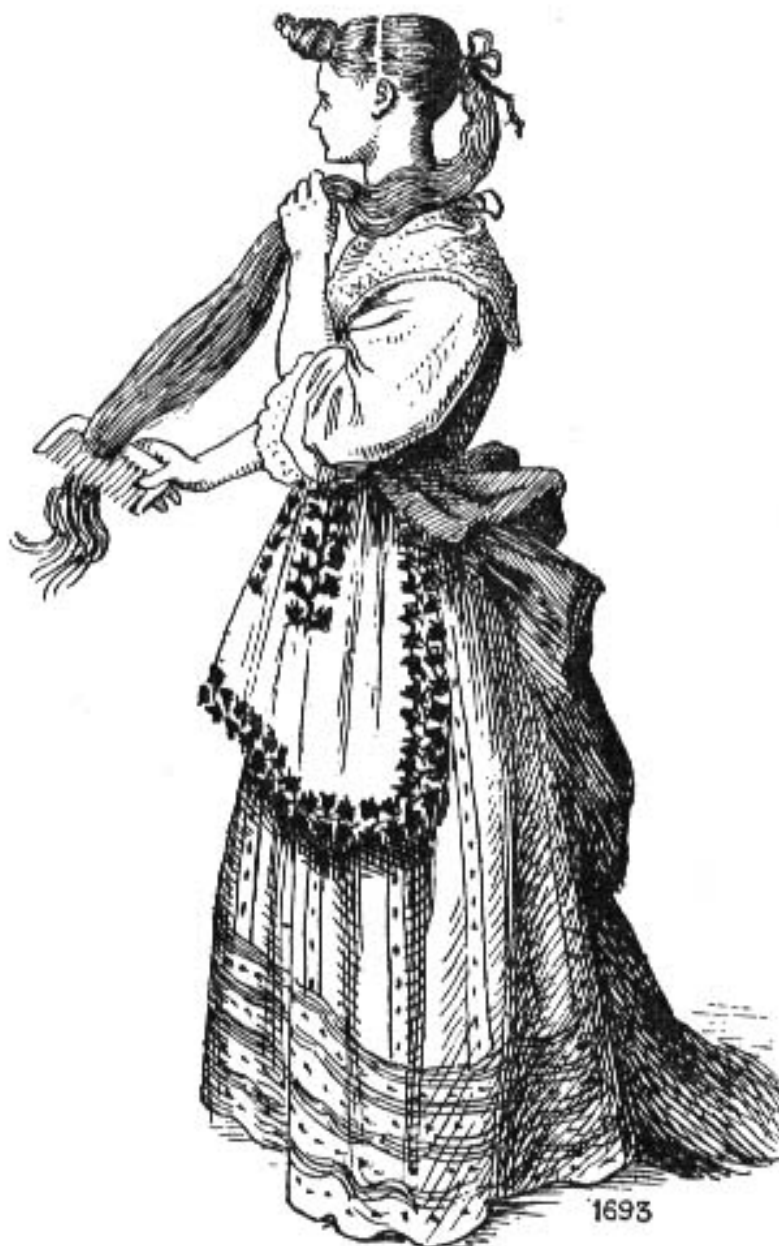
Fig. 69 Fille d'honneur à sa toilette, d'après Arnoult.

Декоративное решение женского костюма находится под влиянием придворного этикета и стиля барокко. В начале века наблюдается стремление расположить всю отделку и украшения спереди (что характерно и для мужского костюма). Это было вызвано необходимостью в присутствии короля стоять к нему только лицом.