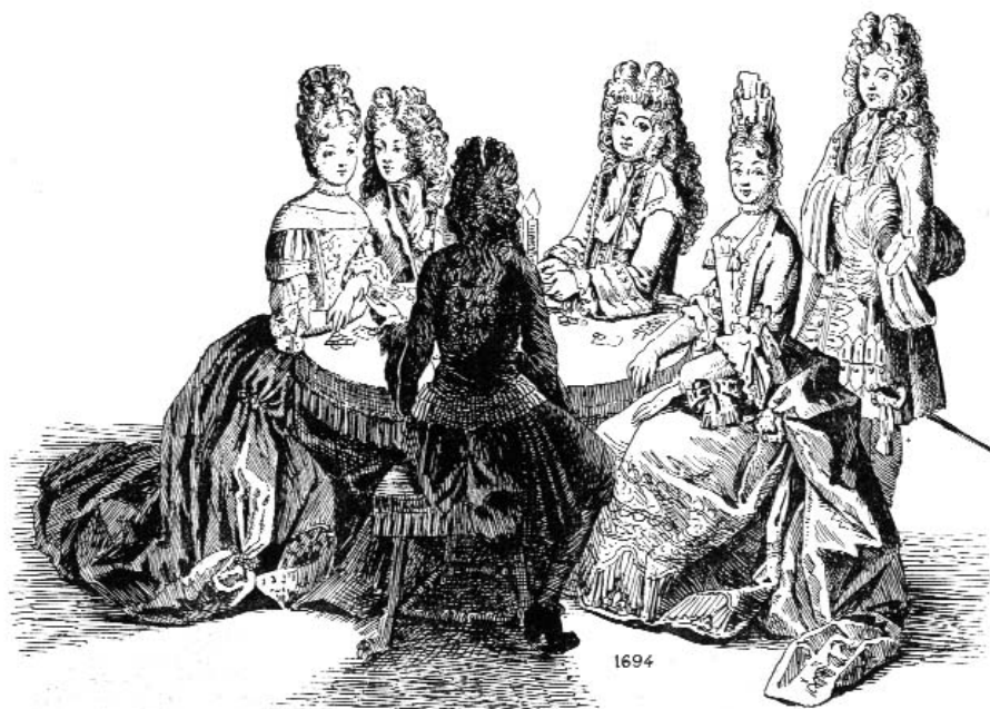
Fig. 46 Toilette de ville et toilette de cour, seconde chambre des appartements d'après Trouvain. Princesse de Conti en toilette de ville, Duchesse de Bourbon en toilette de cour.

Тонкий белый или кремовый батист в сочетании с легкими дорогими кружевами прекрасно подчеркивал гладкость и свежесть кожи, живой цвет красивого лица, сияние глаз.