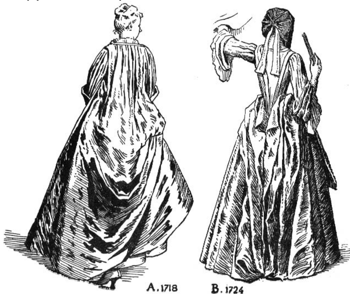
A. Robe battante d'après Watteau — B. robe ajustée à la taille et manteau rattaché derrière, d'après Bernard Picart.

. В начале этого периода в женской моде появляется особая часть верхней одежды, называемая контуш (contouche). Это был выходной верхний наряд, пришитый сзади у горла к нижнему платью, который свободно ниспадал вниз богатыми складками, без обычного сужения в талии. Если контуш был короткий, едва до колен, то его носили как домашний костюм; в таком виде он был особенно распространен в Германии. Около 1730 года, сшитый из дорогого шелка, он относился к числу самой торжественной придворной одежды. Контуш создавал конический силуэт, дополненный прической из напудренных волос, которая заменила кружевную фонтань XVII века. Широкая юбка и лиф нижнего платья укреплялись китовым усом.