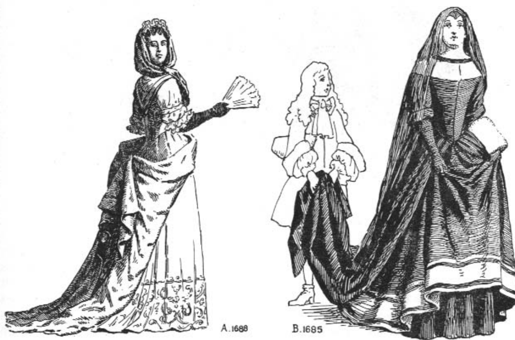
Fig. 45 Toilettes de deuil — A. Petit deuil — B. Grand deuil

Во второй половине века силуэт женского костюма резко меняется. Рукава теряют объем и становятся короче (до линии локтя). Внизу они украшаются широкими кружевными оборками