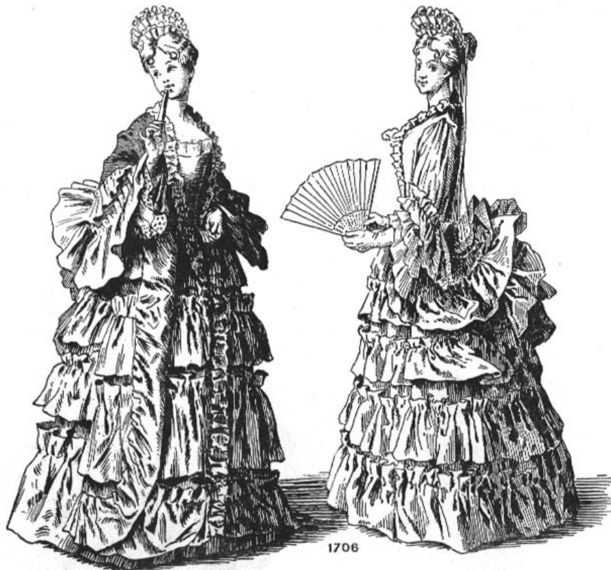
Fig. 44 Robes garnies de larges falbalas avec le manteau troussé en tournure d'après Bernard Picart.