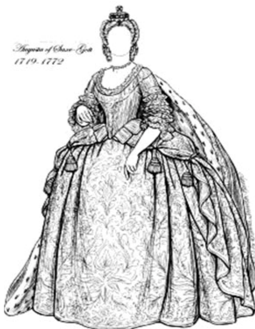
Эскизы костюмов царственных особ 1719-1772