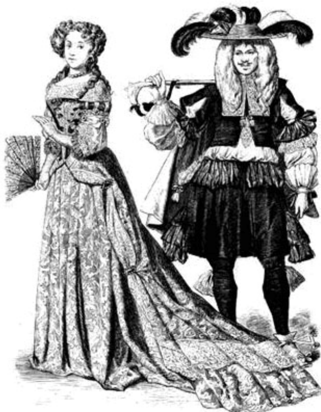
Maria Anna of Bavaria as Crown Princess of France, court dress, 1679