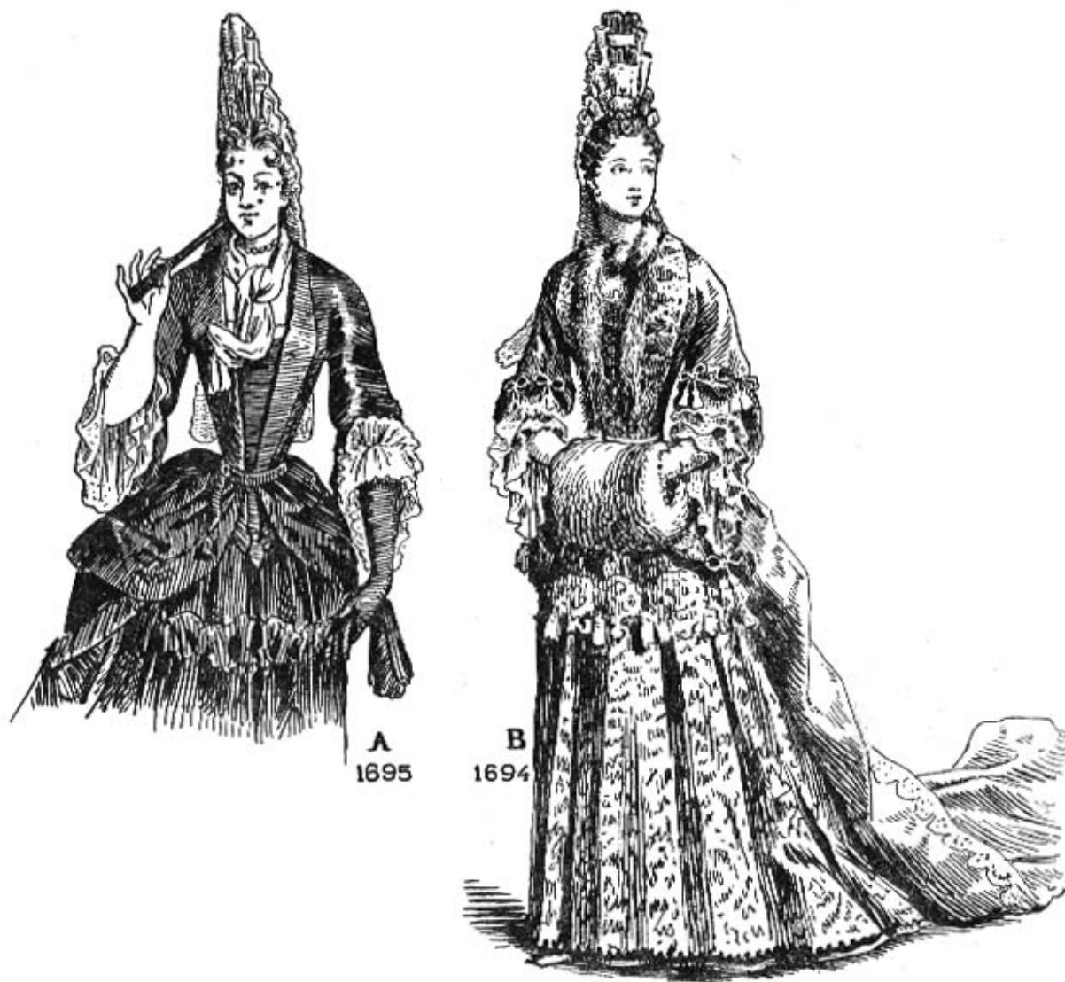
Fig. 64 La palatine en boa, Marquise de Caylus — Cravate en Steinkerque, Duchesse de la Feuillade d'après Trouvain.

Steinkerque cravat 1695 and fur tippet 1694 worn in similar styles.