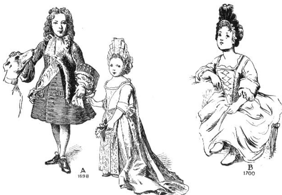
Fig. 80 Jacques Stuart et sa sœur d'après Largillière, galerie des Offices, Florence — B. la fille de Coypel, fontange de velours noir avec dessous rigide en forme de visière relevée.

Корсет контрастировал с огромными юбками, которые кроились круглыми. Чтобы они выглядели пышнее и шире, под них надевали специальные каркасы — фижмы. По этому поводу современники иронизировали: «Если бы мода заразила простых баб, так бы и способа не было по улицам ходить...» Зимние юбки на фижмах простегивались с ватином: широкие юбки были уместны в теплой Франции, а при русских холодах традиционная многослойная женская одежда куда лучше обеспечивала сохранение тепла