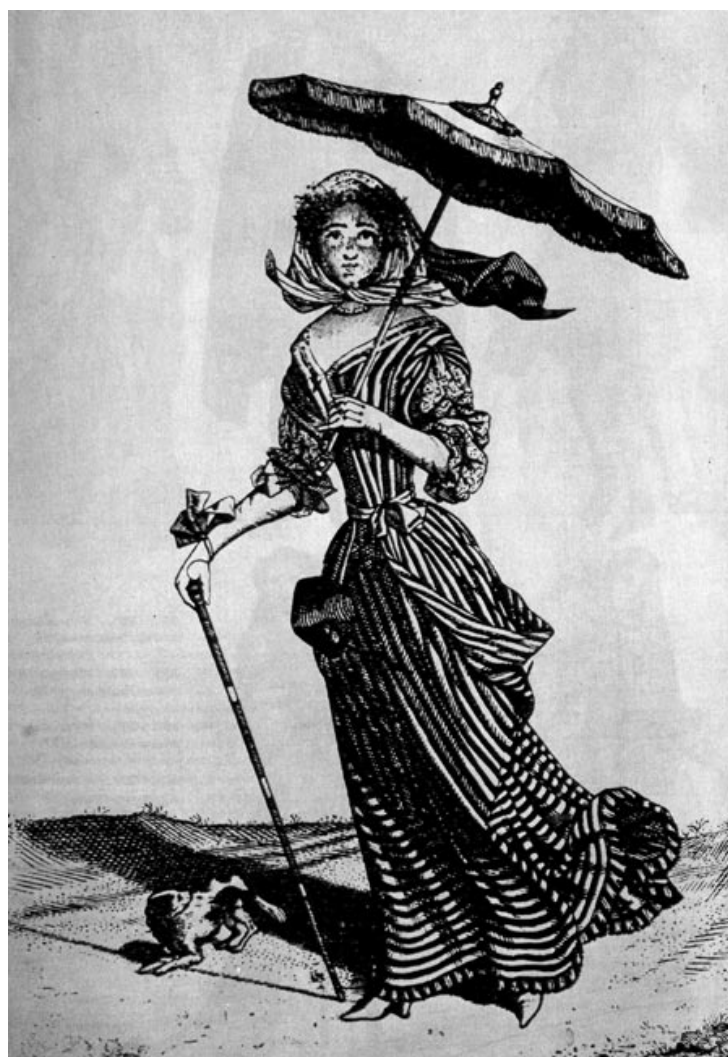
Ж. Д. де Сен-Жан, Дама на прогулке. Гравюра Выходное полосатое платье, легкий платок на голове, зонтик