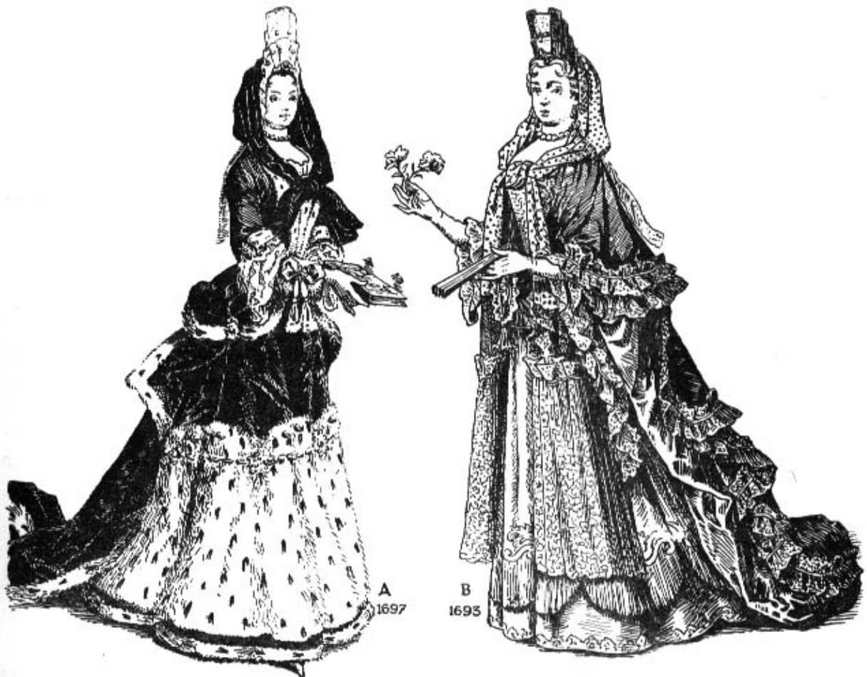
Fig. 77 A. Madame de Maintenon d'après Trouvain, toilette garnie d'hermine, coiffure en fanchon de soie noire posée par dessus la coiffe en fontange — B. mademoiselle d'Auvergne, cape garnie de dentelle, coiffure en fanchon de mousseline à pois.

Mme de Maintenon 1697, Mlle. d'Auvergne 1693