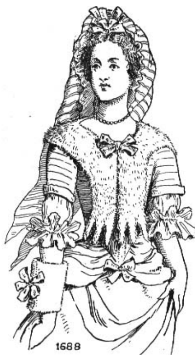
Fig. 65 Palatine en forme de pélerine. Manchon minuscule. меховой воротник 1688

Для тепла бытовали мягкие меховые воротники, которые свободно накидывались на плечи и крепились на груди бантом или драгоценной брошью.