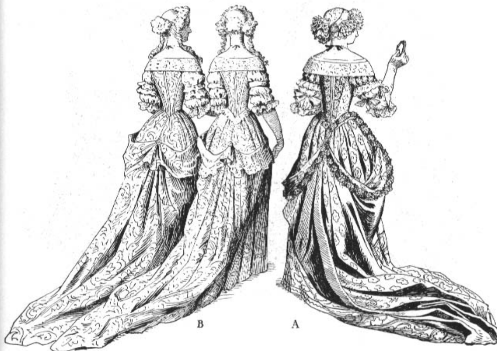
Fig. 43 Toilettes habillées. Façon de relever le manteau de robe — A. d'après Jean de Saint-Jean 1682 — B. d'après un almanach 1682.

Во второй половине века силуэт женского костюма резко меняется. Рукава теряют объем и становятся короче (до линии локтя). Внизу они украшаются широкими кружевными оборками