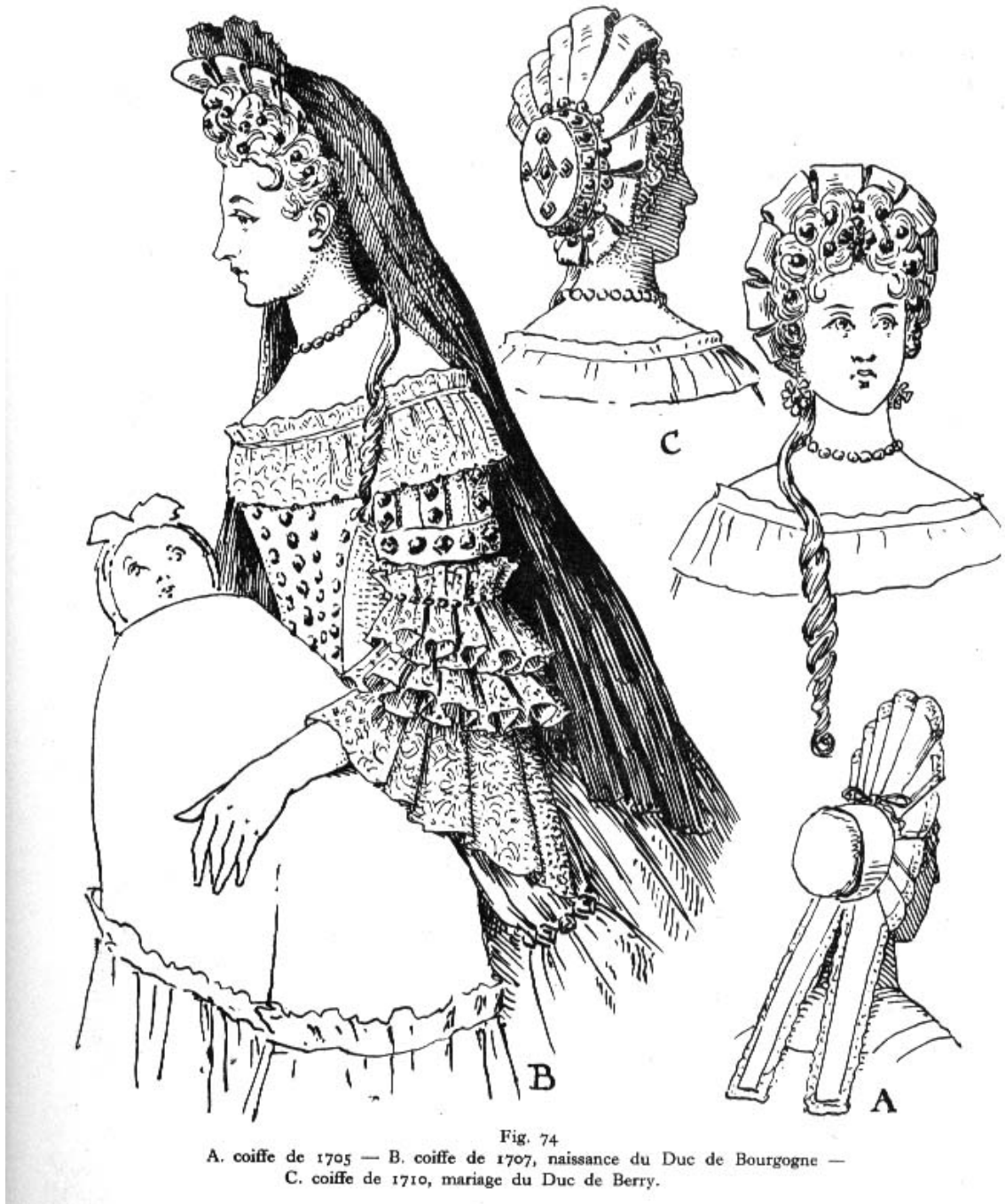
Fig. 74 A. coiffe de 1705 — B. coiffe de 1707, naissance du Duc de Bourgogne — C. coiffe de 1710, mariage du Duc de Berry.

Наряд дамы - вершина моды того времени. В открытый спереди до талии лиф вшивали либо перевернутый клин, либо маскировали расшитым "корсетом". Сзади вырез поднимался к шее; края выреза обшивались муслиновыми оборками. Нежный батист как бы выплескивался из выреза. Соединенная с лифом присборенная юбка со шлейфом отворачивалась назад, к турнюру. Открывавшаяся таким образом нижняя юбка была богато украшена по линии бедер и подолу оборками и полосами гофрированной ткани.