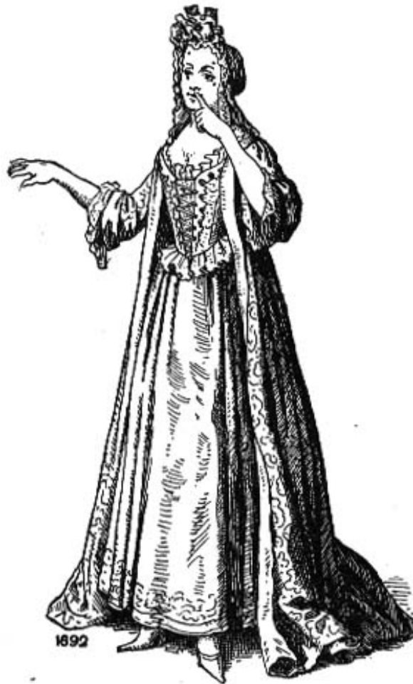
Fig. 62 Toilette négligée du matin. Robe de chambre sur gourgandine demi-baleine. — Cornette de nuit. La dame n'est pas encore coiffée.

At home dress for the morning worn over a boned bodice, 1692