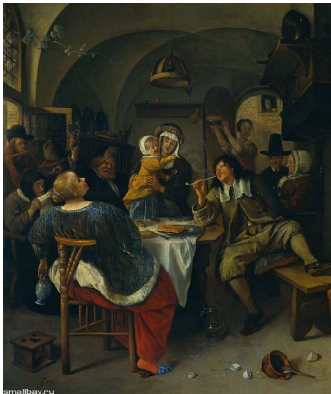
Семейный праздник 1679