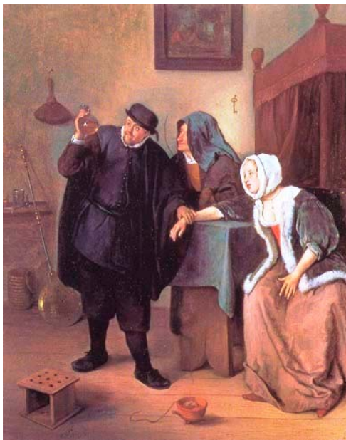
Больная и врач 1660-е