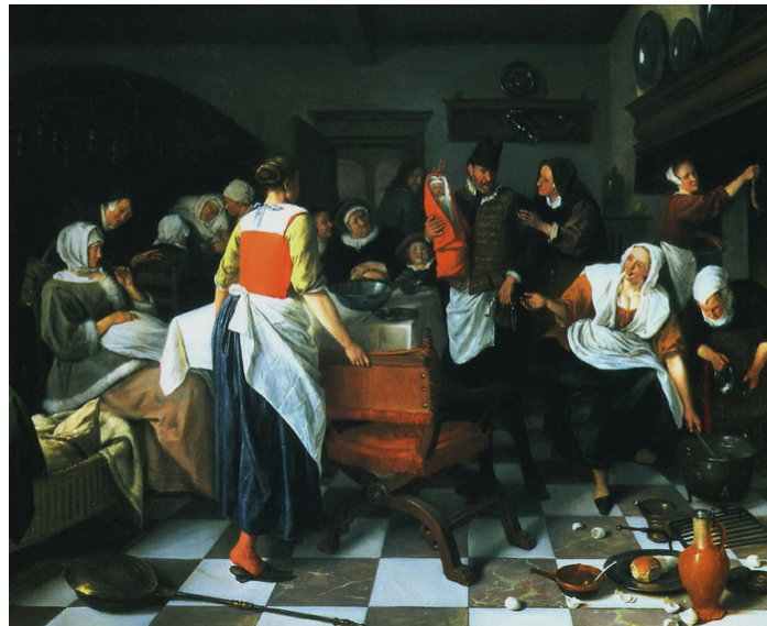
Празднование крестин 1664

Семейный праздник «День святого Николаса». Пожилая дама приехала в многодетный дом родственников. Она старалась, привезла гостинцы. Только вот детки как-то не очень радуются и не выражают любовь к бабушке. Они чисто и дорого одеты, взяли подарочки да и спасибо. Правда, у них тоже своя иерархия: кто-то любимчик, а кто-то нет. А в дверях маячит пожилая вдова, которая явно настроила детишек против доброй родственницы. Обычно так выражается нелюбовь свекрови к теще. Какой вечный сюжет и как часто такое бывает.