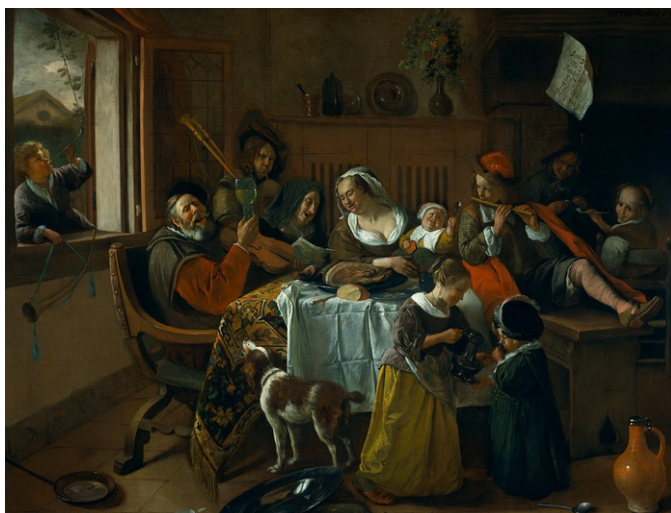
Веселая компания 1668