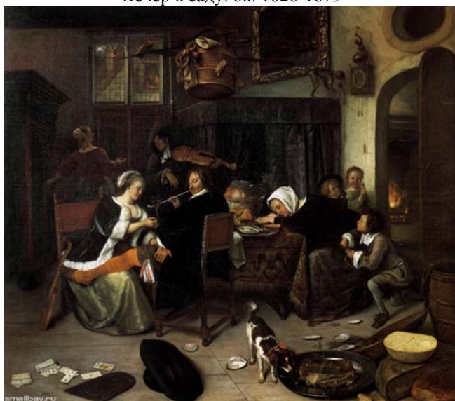
Беспутный дом 1661-1664