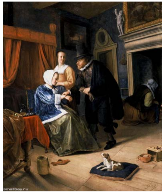
Мнимая больная девушка, 1665

В кресле полулежит молодая женщина. Она только что оправилась после легкого обморока. Старая служанка привела ее в чувство применявшимся народным средством - запахом сжигаемого шерстяного шнура, полубогоревший огарок которого ещё заметен в стоящей на полу горелке. Как всегда, блестяще передана фактура ткани и пушистого меха. Кристально прозрачный графинчик на оловянной тарелке, голубая фаянсовая чашечка, серебряная ложка, возможно, пергаментный и сафьяновый переплеты книг и другие предметы, находящиеся на столе, покрытом фиолетовой бархатной скатертью, составляют один из лучших натюрмортов, включённых в картину.