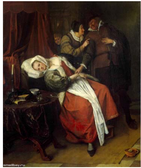
Больная и врач 1660-е