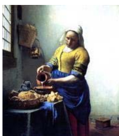
Ян Вермер Делфтский Служанка с кувшином молока Ок. 1658

Для улицы использовался недлинный суконный балахон с запахом. Голову так же покрывал белый чепец с длинными свисающими ушками.