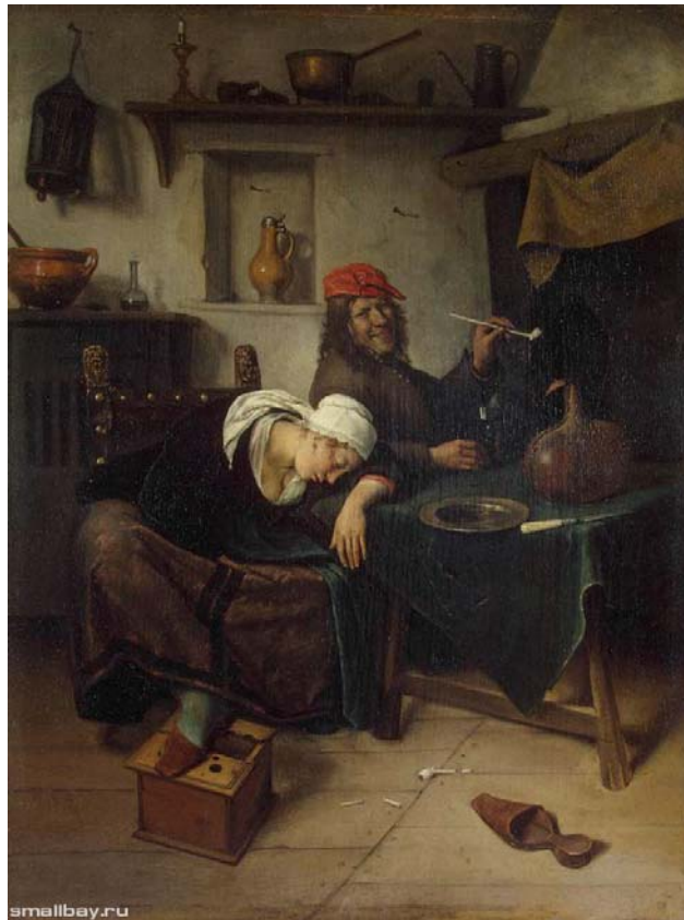
Гуляки, 1660 Эрмитаж, Санкт-Петербург