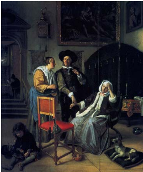
«Визит врача» (1661-62)