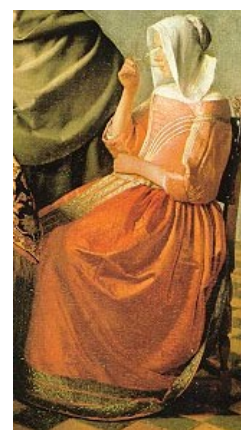
Ян Вермер Десфетский Бокал вина Ок. 1660 (фрагмент)

Картины голландских художников позволяют достаточно хорошо рассмотреть костюм со всех сторон и разобрать детали. Начнем с Рембрандта Харменс ван Рейн, картины 1654 и его «Купающаяся женщины», где очень хорошо изображена исподняя рубашка.