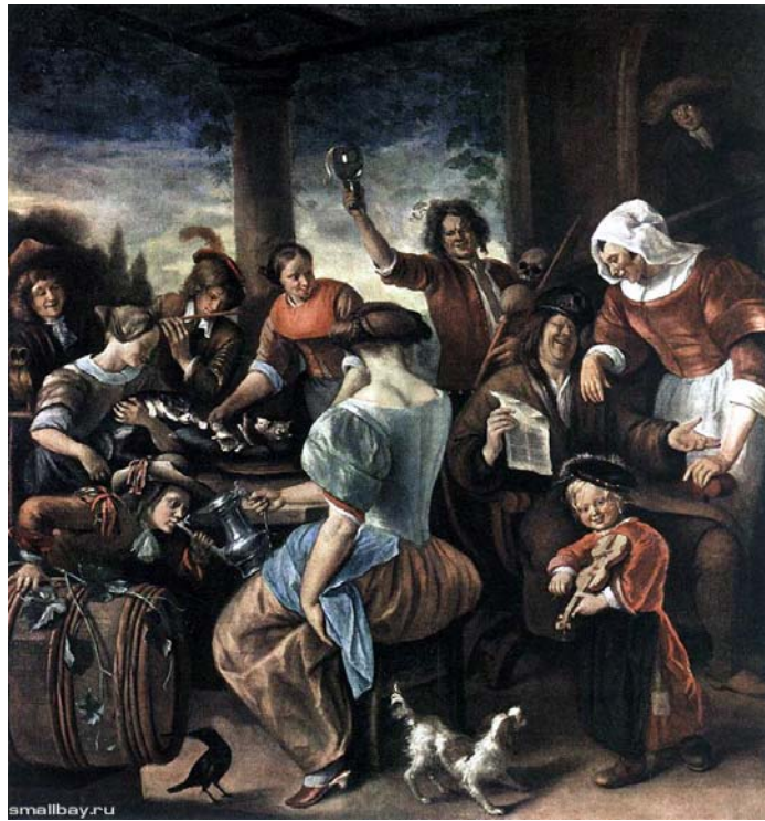
Веселое общество 1660

Крестьянская свадьба. Про эту картину тоже надо сказать пару слов. Молодая вдова с детьми выходит замуж за деревенского богача. Старший мальчик тащит мать за подол, ревнуя к новому отцу, второй ребенок сосет грудь кормилицы. Рука на животе свидетельствует о приличном сроке беременности невесты. Еще один яркий персонаж на картине – это женщина с фонарем, то ли сваха, то ли сводня. И маленькая собачка в левом углу ставит все точки. Свадьба против правил морали, против советов друзей, в угоду слабым надеждам на призрачное богатство.