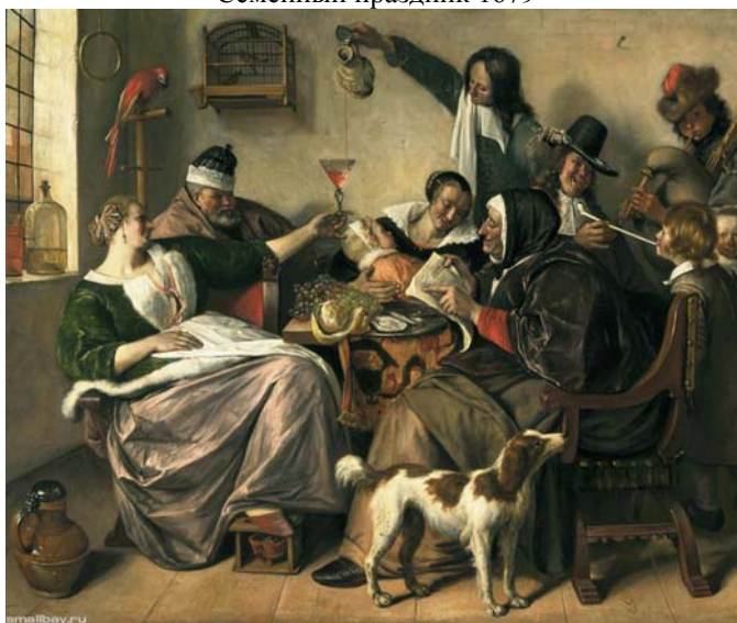
Веселье в семье художника . (Праздник бобового короля.)16631665