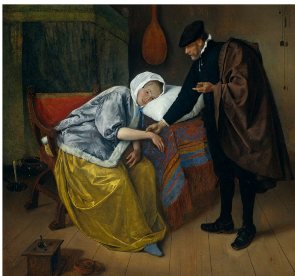
Ян Стен. Больная и врач. Конец 1650-х - начало 1660-х гг. Амстердам, Рийкс музей

Здесь не врач должен помочь. Но она не может опуститься до незаконной связи с мужчиной, а женихи почему-то не толпятся у входа. А может быть это вдовушка в расцвете лет? Мы ведь ничего не знаем, кроме того, то нарисовано и то, как названа картина.