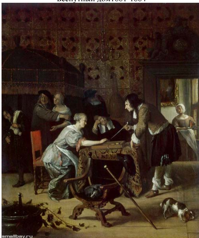
Игроки в трик-трак 1667