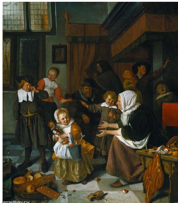
День святого Николаса, 1668

Семейный праздник «День святого Николаса». Пожилая дама приехала в многодетный дом родственников. Она старалась, привезла гостинцы. Только вот детки как-то не очень радуются и не выражают любовь к бабушке. Они чисто и дорого одеты, взяли подарочки да и спасибо. Правда, у них тоже своя иерархия: кто-то любимчик, а кто-то нет. А в дверях маячит пожилая вдова, которая явно настроила детишек против доброй родственницы. Обычно так выражается нелюбовь свекрови к теще. Какой вечный сюжет и как часто такое бывает.