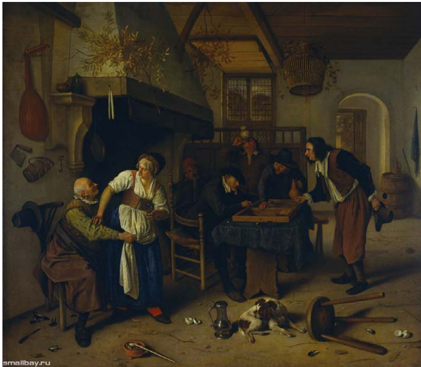
В таверне 1679