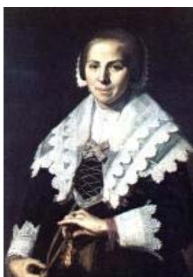
Франс Халс Портрет дамы с веером 1640