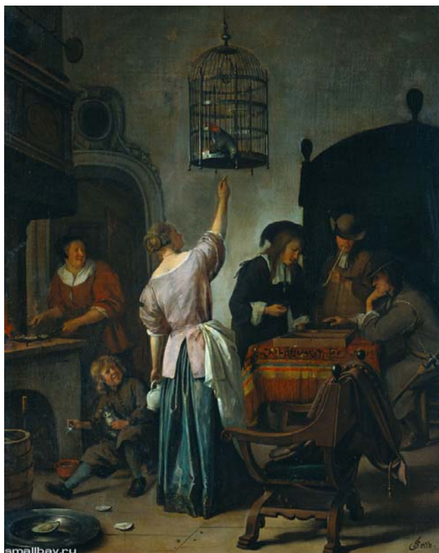
Клетка с попугаем 1670

Приведу еще несколько картин, надеюсь, что новеллы о жителях Голландии в середине XVII века вам понравились и вы дальше продолжите исследование книг, написанных без помощи слов, а только кистью, вedomой рукой удивительного художника Яна Стена.