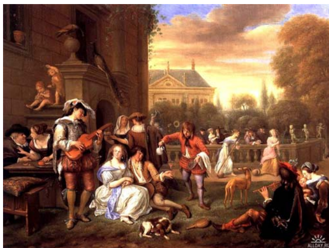
Вечер в саду, ок. 1626-1679