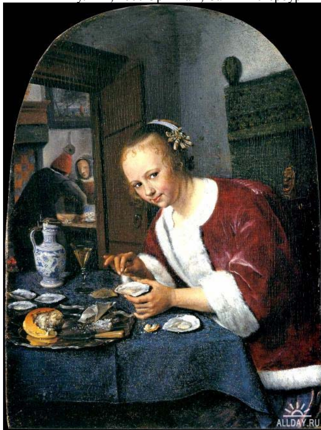
Девушка с устрицами 1658-1660, Маурицхейс, Гаага

Привлекает внимание чудесный портрет юной бюргерши в таверне. Ничего необычного. Мужчины на заднем плане нас не интересуют. Вот только устрица тоже один из символов женских половых органов. Вот и выходит, что девушка с нетрадиционной