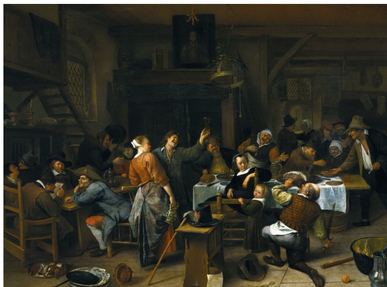
Гулянка в день рождения принца Вильгельма III