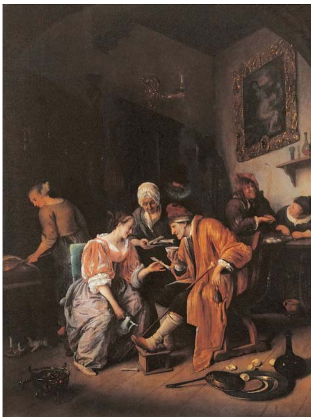
Больной (немощный) старик

Интерьер дома свидетельствует о том, что когда-то успешный бюргер с хорошим достатком превратился в старого обрюзгшего скупердяя. Он шантажирует все семейство возможностью наследства, заставляя терпеть свои капризы. Врача в этой картине нет, нельзя вылечиться от жадности и старости. И в этом - весь Ян Стен.