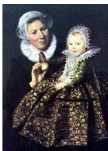
Франс Халс Гувернантка с ребенком 1620

Отдельного упоминания требует изображение детей, по тем временам в семьях их было много, но как такового детского платья не существовало, его шили таким, же, как взрослое, только меньшего размера. По мере вырастания вещи передавались от старших к младшим.