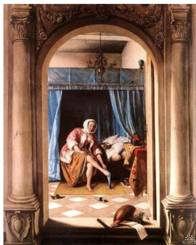
Туалет женщины, 1660 Рейксмузеум, Амстердам

Специально привожу рядом две почти одинаковые картины. Про чулок мы уже упоминали, и в данном контексте он символизирует томление плоти. В постели разлеглись собачки, на обеих картинах они как близнецы, похоже написанные с натуры. А теперь в чем разница. В том, что первая барышня проснулась с утра. Она меняет чулки. Рядом стоит полная ночная ваза. А вторая вечером раздевается после веселой вечеринки. Она богата и одарена, умеет петь и танцевать. Но ее чарам никто не поддался.