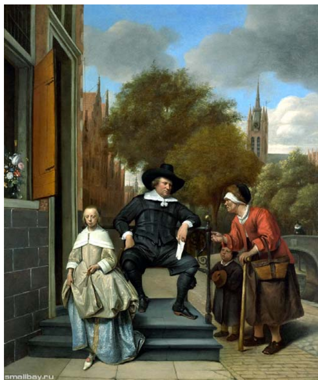
Жители Делфта, 1655 Рейксмузеум, Амстердам