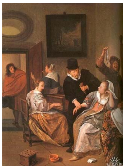
Визит врача. 1663-65. Филадельфия Музей искусств

Отдельно расскажем о картине «Визит врача» 1663 года. Здесь мы видим врача и его пациентку уже в совершенно другой обстановке. Он был вызван, очевидно, к одной из девиц, внезапно почувствовавшей себя плохо, во время весёлой вечеринки. Так эту картину трактует Семен Талейник. Но мне кажется сюжет более пикантный. Молодая служанка вернулась с улицы в дом. Она в верхней одежде. Тут, ей сделалось плохо, и она без чувств упала в кресло, прямо в гостиной. От резкого запаха такое случается у чувствительных особ в интересном положении. В это время у госпожи было свидание с женихом, которого она завлекала игрой на клавикордах. Явившийся на зов врач в замешательстве, как объявить свой диагноз. А молодой повеса, видимо виновный в случившемся быстро ретируется, увернувшись от другой служанки. Самый главный персонаж на этой картине – это человек с рыбой, в котором художник изобразил себя. И рыба. По средневековой мифологии это символ всего сущего и тщетности жизни. Трагизма на этой встрече с врачом нет. В то же время иронии и доброго юмора достаточно.