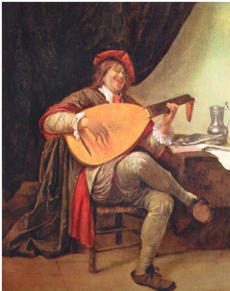
Ян Стен Автопортрет с лютней 1663-1665

Например, что особенного мы углядим в женщине, штопающей чулок? Ничего. А во времена Стена словом "чулок" обозначался женский половой орган. Не правда ли, теперь мы посмотрим на соответствующую картину совсем по-другому? Яйца, присутствующие в ряде работ художника, тоже о многом говорили голландцу, изо дня в день слышавшему выражение "разбивать яйца о сковороду" и понимавшему, что речь идет вовсе не о яичнице, а о вступлении в любовную связь.