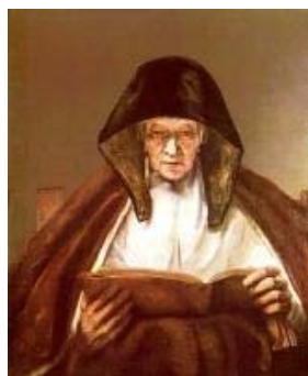
Рембрандт Харменс Ван Рейн Старушка за чтением. 1655 г.

Как правило, в услужении у неё была горничная. Одежда, которой отличалась от госпожи меньшей добротностью тканей, и возможным отсутствием нижних юбок и лиф для теплого времени года шился без рукавов, превращаясь в корсаж. Или лиф делался более свободным ( без дополнительной поддержки) и длинным, превращаясь в верхнюю блузу. Длина юбки, могла доходить до щиколотки, для удобства передвижения. Завязки исподней рубахи завязывались плотнее, но это больше зависело от нрава девицы. Цвета одежды могли быть самые разные т.к. лиф и юбка шились из разных тканей. На картинах мы видим сочетания красного с синим, синего с сиреневым, желтого с синим.