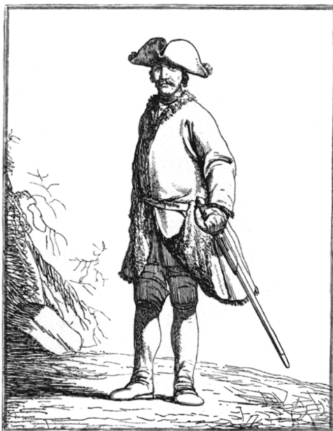
Лб.-компанецъ въ зимнемъ одѣяніи, съ офорта Дальстена.

Будем надеяться, что впереди его ждут лучшие времена.