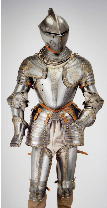
Ил. 5. Доспех Генри Герберта, 2-го графа Пембрука

Формы бюста, линии плеч и талии, изящество бедер в доспехах изготавливались как в повседневном costume, следовали канонам гражданской моды.