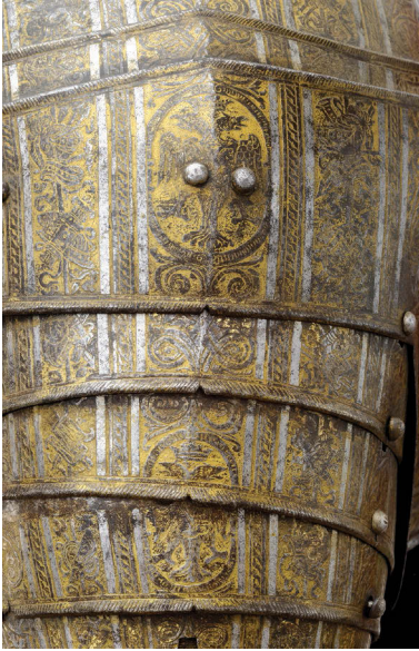
Ил. 23. Изображение двуглавых орлов – гербов Российского государства на наручах доспеха Лжедмитрия I. 1605–1606 гг.