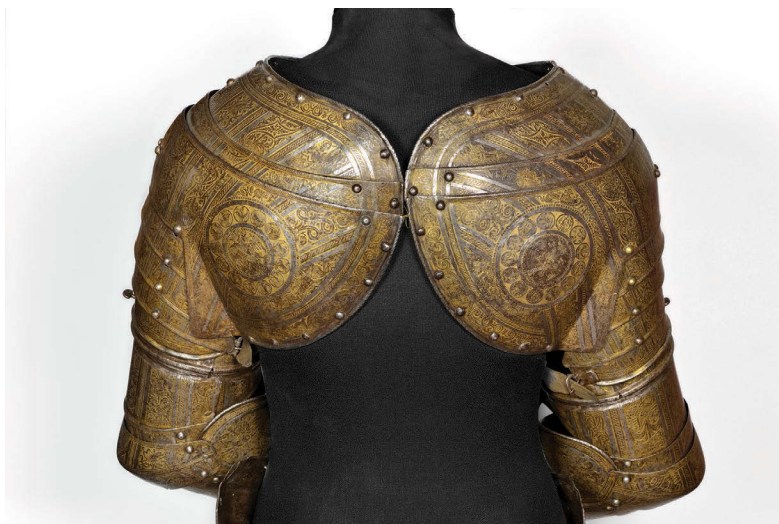
Ил. 20. Части доспеха (оплечья, наручи и набедренники) Лжедмитрия I. 1605–1606 гг. Вид оплечий со спины