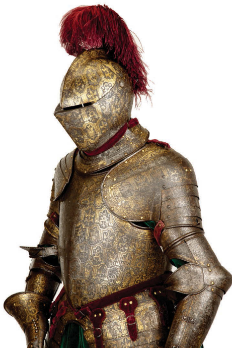
Ил. 9. Доспех. Около 1590 г. Worcester Art Museum, № 2014. 112