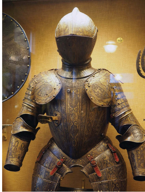
Ил. 16. Доспех. 1590 г. (Wallace Collection, № A38, A335, A228)

На иноземное происхождение мастеров указывает то, что геральдические эмблемы некоторых областей Московского государства, входящие в состав печати и изображающие зверей, переделаны