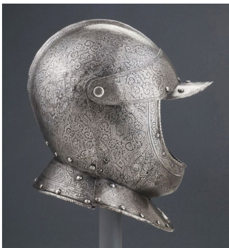
Ил. 11. Шлем типа «бургиньот». 1590–1600 гг. Philadelphia Museum of Art, № 1977-167-126

В богатейшем оружейном собрании Военно-исторического музея артиллерии, инженерных войск и войск связи хранится еще один из доспехов, выполненных в мастерской Помпео делла Кьеза для русского царя-самозванца Лжедмитрия I. История этого доспеха крайне интересна.