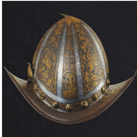
Ил. 17. Шлем-морион с аукциона Lennart Viebahn