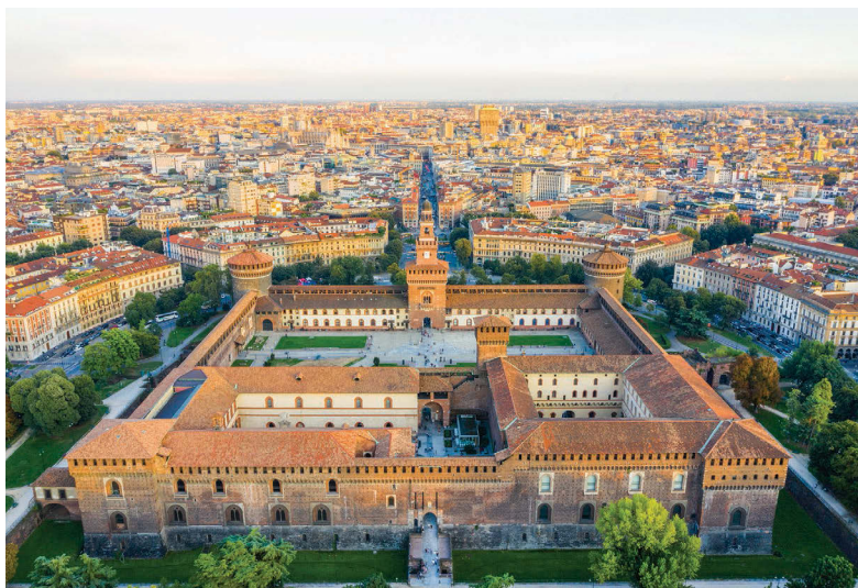
Ил. 4. Замок Сфорца. Вид с высоты птичьего полета. Современная фотография