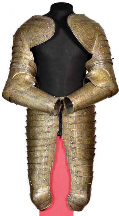
Ил. 18. Части доспеха (оплечья, наручи и набедренники) Лжедмитрия I. 1605–1606 гг. Вид спереди