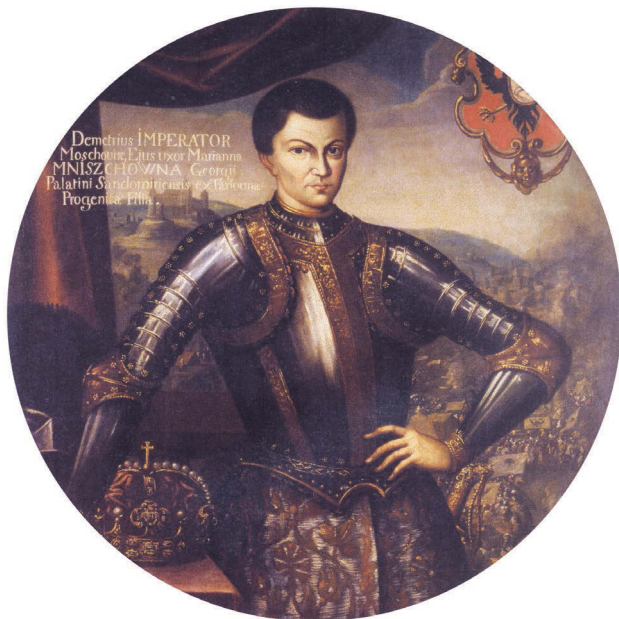
Ил. 25. Портрет Лжедмитрия I. Неизвестный художник. Первая треть XVII в. Государственный исторический музей, Москва

Дмитрии: «Он был мужчина крепкий и коренастый, без бороды, широкоплечий... обладал большой силой в руках» 25 . Другой иностранный наблюдатель пишет о Лжедмитрии как о человеке среднего роста 26 (ил. 25).