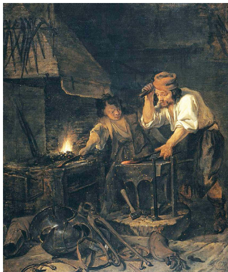
Ил. 1. Оружейник. Художник Габриэль Метсю. 1650 – 1660-е гг. Рейксмюсеум, Амстердам

Д ОСПЕХИ БЫЛИ ЧАСТЬЮ мира вещей эпохи Средневековья, Ренессанса и раннего Нового времени. Они свидетельствовали о положении человека в обществе, о его заслугах, состоянии и личной власти. Доспехи королей и полководцев богато украшались чеканкой или гравировкой по металлу с травлением и покрывались золотом, а иногда, но очень редко,