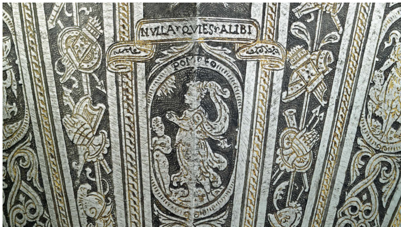
Ил. 6, 7. Клейма Помпео дела Къеза на доспехах

Доспех, выполненный для русского царя Дмитрия Иоанновича – Лжедмитрия I (1605–1606) считается последней работой великого мастера. Тем не менее, по некоторым сведениям, с 1593 г. Помпео делла Къеза, будучи уже престарелым по меркам того времени человеком, сам не работал над заказами, но по-прежнему контролировал работу своей мастерской, в которой трудились его ученики 8 . Он прожил долгую для своей эпохи жизнь и скончался в Милане 21 марта 1610 г.