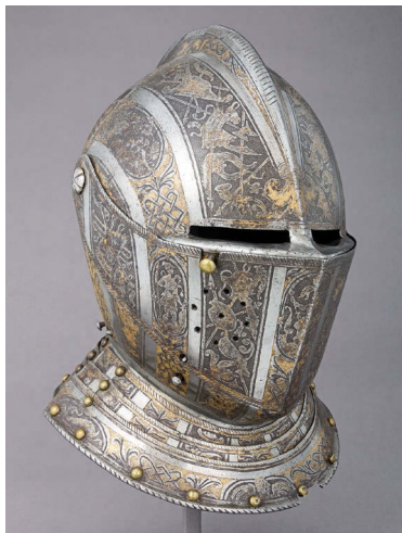
Ил. 15. Шлем. 1585 г. (The Metropolitan Museum of Art, № 14.25.656)