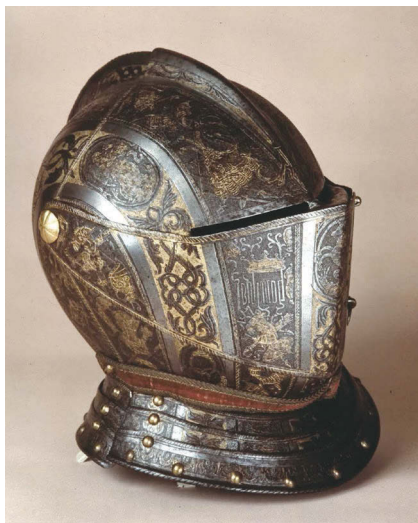
Ил. 8. Шлем Ренато I Борромео

Полные доспехи и их отдельные части, изготовленные Помпео, хранятся в различных коллекциях мира. Так, например, судя по описанию миланской коллекции Польди-Пеццоли ( Museo Poldi Pezzoli ), выполненному Л. Г. Боккиа и Ж. Годоем, там хранится шлем, сделанный в 1585–1590 гг. мастером для местного аристократа Ренато I Борромео 13 . В 1591 г. он стал капитаном, а в 1598 – послом при дворе испанского короля Филиппа III. Кроме того, он был братом кардинала Федерико Борромео. В этом семействе родился видный деятель Контрреформации святой Карло Борромео. Шлем декорирован гравировкой, расположенной поясами, узор распространяется и на забрало. Среди изображений – эмблема с герба семьи Борромео – единорог, конная узда, святая Иустина, девиз «HOMILITAS» («Смирение») (ил. 8).