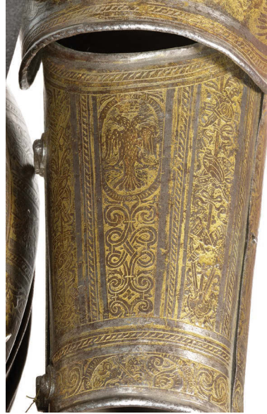
Ил. 24. Изображение двуглавого орла – герба Российского государства на наручах доспеха Лжедмитрия I. 1605-1606 гг.