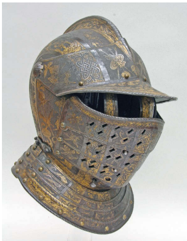
Ил. 14. Шлем. 1590–1595 гг. (The Metropolitan Museum of Art, № 14.25.603)