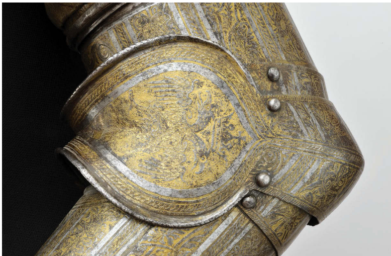
Ил. 22. Изображение двуглавого орла – герба Российского государства на локтевой защите наручей доспеха Лжедмитрия I. 1605–1606 гг.

Сочетание государственного герба с изображением государственной печати, несомненно, указывает на принадлежность доспеха одному из русских государей конца XVI – начала XVII в.