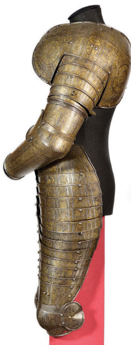
Ил. 19. Части доспеха (оплечья, наручи и набедренники) Лжедмитрия I. 1605–1606 гг. Вид сбоку

на западноевропейский манер. Так, например, вместо северного оленя изображена дикая коза.