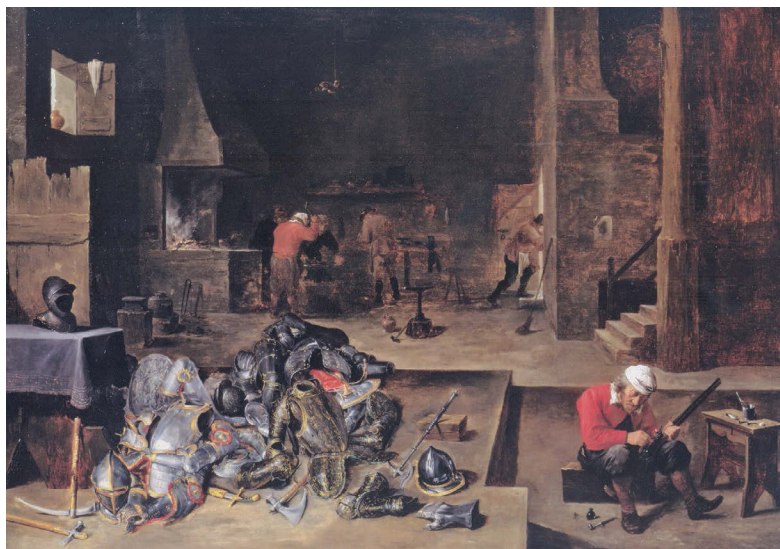
Ил. 2. Оружейная мастерская. Художники Давид Теннерс Младший и Ян Брейгель Младший. 1640–1645 гг. Музей искусства, Северная Каролина, США

производителей изысканных декорированных доспехов, отличавшихся высокохудожественной гравировкой, выполненной в стиле богатых итальянских тканей ( i motivi a tessuto ). Такие доспехи, изготовленные в технике чернения или золочения, были покрыты узорами, напоминавшими лучшие текстильные образцы. Пальмовые ветви, военная арматура, трофеи с элементами оружия искусно сочетались с выгравированными орнаментами, изображениями аллегорических фигур и мифологических персонажей, владельческих гербов и девизов.