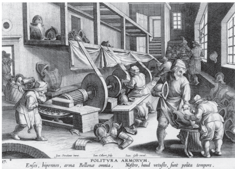
Ил. 3. Полировка доспехов в оружейной мастерской. Гравюра XVII в.