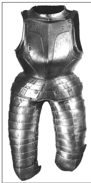
Доспехи бранденбургского курфюрста Иоахима II Гектора (?) Германия. 1547 г. Инв. № 0137/79

После краха Реформации в Чехии (1620-е) Ягерндорф, как лен короны св. Вячеслава, был отозван у Гогенцоллернов и отдан Лихтенштейнам. Таким образом «три рожка» еще раз подтверждают версию о принадлежности доспеха курфюрсту Иоганну Георгу (либо, что менее вероятно, Иоахиму Фридриху).