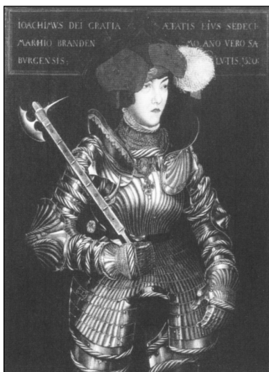
Лукас Кранх. Портрет курфюрста бранденбургского Иоахима I Нестора. 1520 г. Копия. XIX в.

Иоахим был правителем решительным и жестким, но также и незаурядным, широко мыслящим. В 1506 г. он основал университет во Франкфурте-на-Одере. При нем наследственное право Бранденбурга было унифицировано и переработано с точки зрения норм римского права и издано