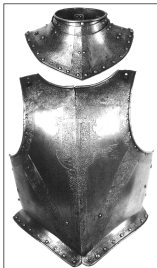
Доспехи бранденбургского курфюрста Иоганна Георга. Германия. Середина XVI в. Инв. № 0137/128

В собрании музея хранится еще один неполный доспех, на нагрудной части кирасы которого также изображен бранденбургский герб, но уже с дополнительными геральдическими составляющими. Доспех когда-то был покрыт позолотой, в настоящее время практически утраченной. Незначительные фрагменты ее сохранились на ожерелье и