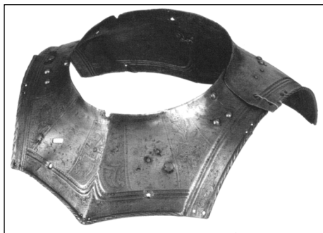
Ожерелье от доспеха бранденбургского курфюрста Иоахима II Гектора (?). Германия. 1547 г. Инв. № 0137/79

Доспехи бранденбургских курфюрстов, видимо, оказались в Достопамятном зале – предшественнике ВИМАИВиВС – во время Семилетней войны