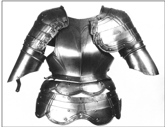
Доспехи бранденбургского курфюрста Иоахима I Нестора или Иоахима II Гектора. Германия. Нюрнберг. 1525–1564 гг. Инв. № 0137/75

Один из доспехов покрыт великолепной золоченой гравировкой, выполненной в стиле Северного Возрождения. Верхняя часть кирасы украшена изображением распятого Иисуса Христа. По бокам от Распятия расположены два сюжета, заимствованных из «Книги Судей» Ветхого Завета и повествующих о подвигах библейского богатыря Самсона. Согласно преданию он так верил в свои силы, что в одиночку ходил в филистимские города... Однажды Самсон остался ночевать в Газе. С наступлением вечера городские ворота закрыли и поставили возле них стражей, которым было приказано под утро внезапно напасть на Самсона и убить его. Но тот догадался о засаде, убил стражей, а тяжелые городские ворота высадил, взвалил на плечи и отнес на вершину горы, на пути к Хеврону. Этот подвиг, свидетельствовавший не только о необычайной силе Самсона, но и о его небывалом хитроумии, содействовал его славе. На доспехе богатырь изображен выносящим на плечах городские ворота. Ногами он попирает поверженных