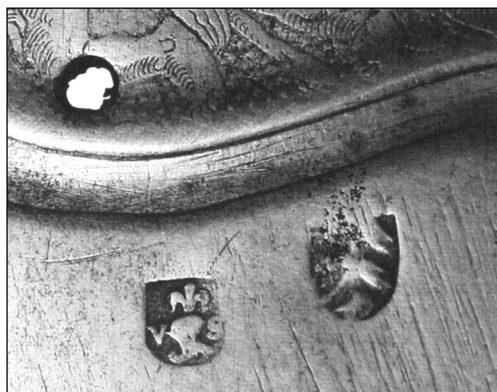
Клеймо мастера Валентина Зибенбюргера и клейма города Нюрнберга на кирасе

Если взять крайние даты деятельности Валентина Зибенбюргера – с 1525 по 1564 гг., то