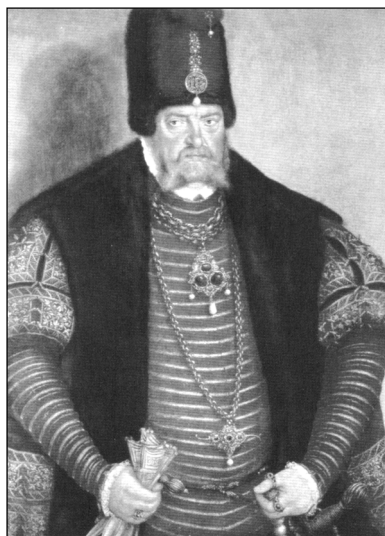
Лукас Кранах (Младший). Портрет курфюрста бранденбургского Иоахима II Гектора. Около 1570 г.

В нарушение принципа неделимости территории, установленного дедом Иоахима курфюрстом Альбрехтом Ахиллом, курфюрст завещал Новую марку своему второму сыну Иоганну, маркграфу Бранденбург-Кюстринскому. Старая марка вместе с саном курфюрста осталась за старшим сыном Иоахимом II, родившимся в 1505 г. Поскольку у Иоганна не было сыновей, Бранденбургская марка воссоединилась уже при внуке Иоахима – курфюрсте Иоганне Георге 3 .