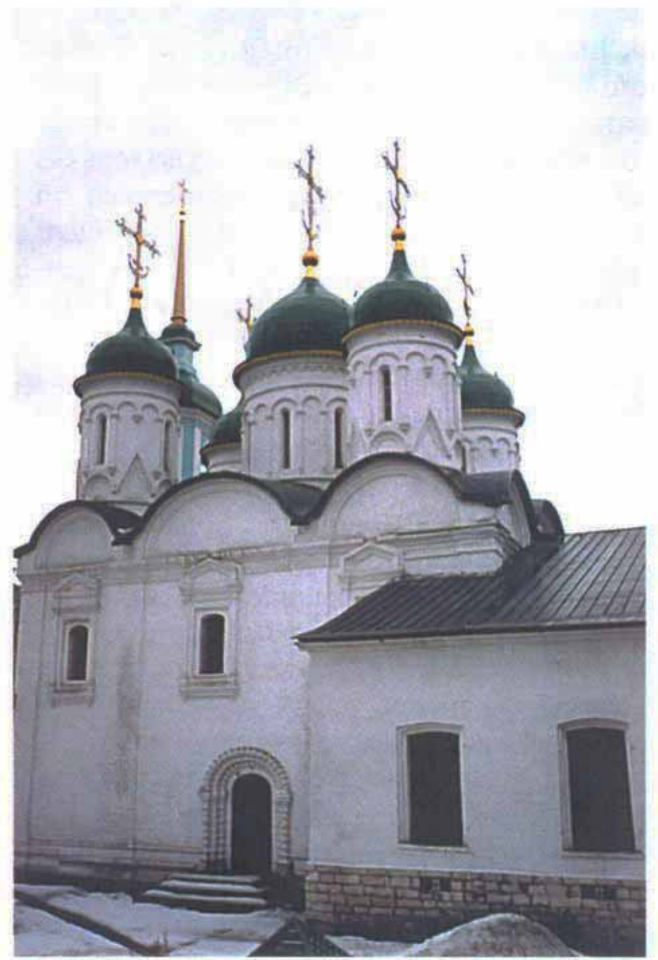
Церковь Троицы в Лиссах. Современные фотографии