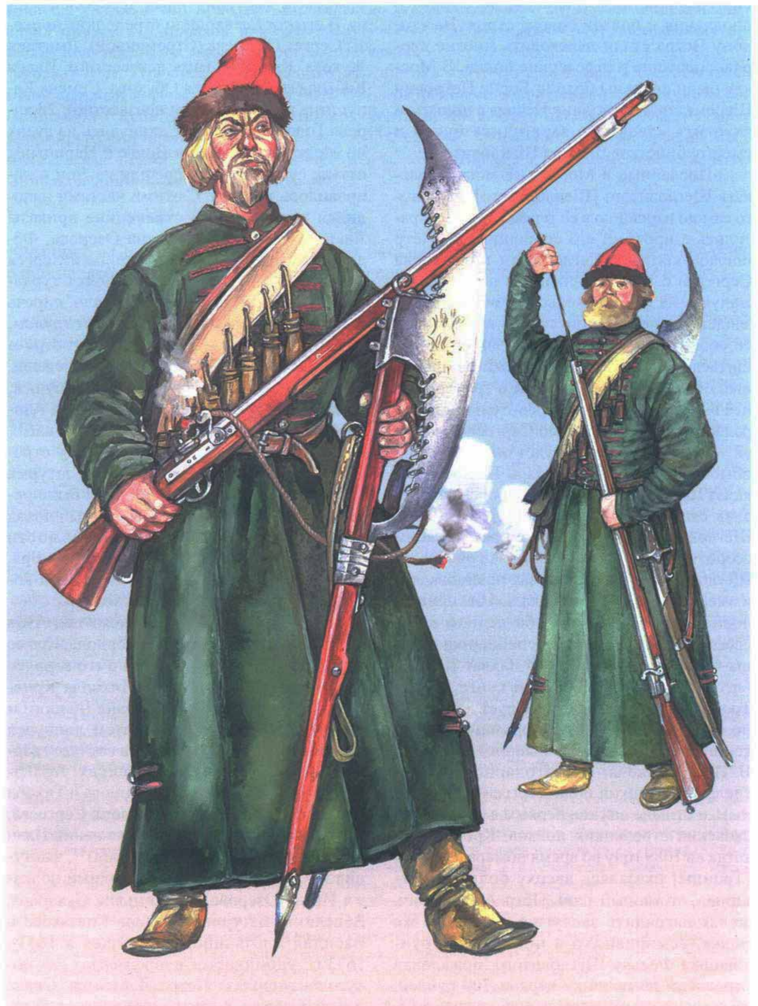
Типикин В. М. Московские стрельцы приказа Василия Пушечникова. 1660 г.